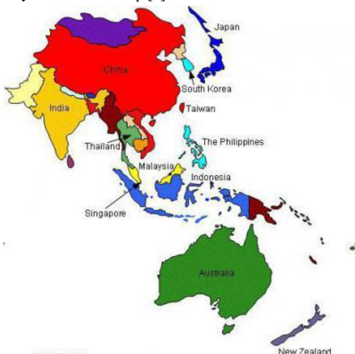
Сурет 1. АТР аумағындағы елдер [6].

АҚШ-тың АТМӨ-дегі Ресейге қатынасын парадоксальды деп сипаттауға болады. Бір жағынан, Вашингтон Ресей мен Америка Құрама Штаттары ортақ шекарасы бар азия - тынық мұхит аймағындағы ең жақын көршілер екенін түсінеді, ал Ресейдің Қиыр Шығысы (Тынық мұхиты Ресей) және Американың сыртқы жағалауы соңғы 20 жыл ішінде тұрақты, бірақ өте тегіс емес, экономикалық, саяси және гуманитарлық байланыстарды қолдайды. Екінші жағынан, АҚШ өзінің сыртқы саясатының Азия - Тынық мұхиты контекстінде Ресейді ешқашан айтпайды.