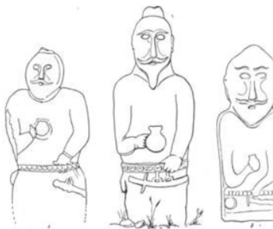
Рисунок 1. Древнетюркское каменное изваяние из урочища Кулада, Алтай [5, с. 73]

Древнетюркские изваяния устанавливались у ритуальных прямоугольных оград, с восточной стороны и лицом на восток. В эту же сторону отходили ряды вертикальных балбалов. Исследователи отмечают, что встречаются и более сложные комплексы, которые состоят из двух или нескольких оградок.