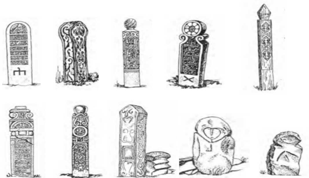
Рисунок 5. Различные типы кулпытасов Западного Казахстана по С.Е. Ажигали [12, с. 320 – 334]

объектов, объединенных в данный тип. Таким образом, отдельные разряды кулпытасов данного региона имеют семантику, связанную с коновязью и, опосредованно, с мировым деревом. Другие же, совершенно другой формы, антропоморфны и генетически связаны с тюркским обычаем установки человеческих фигур.