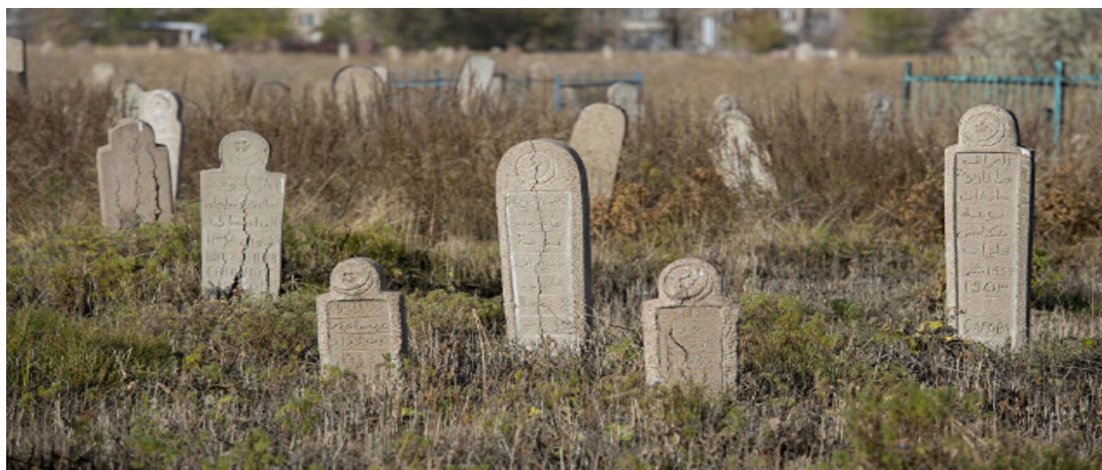
Рисунок 4. Надмогильные камни казахского кладбища Караоткель, г. Астана

У казахов до настоящего времени сохранился обычай установки кулпытасов. Ряд деталей позволяет сделать вывод об их изначальной антропоморфности. В целом, сейчас казахские кулпытасы не обязательно имеют антропоморфный характер, однако традиционная их форма позволяет сделать вывод о них.