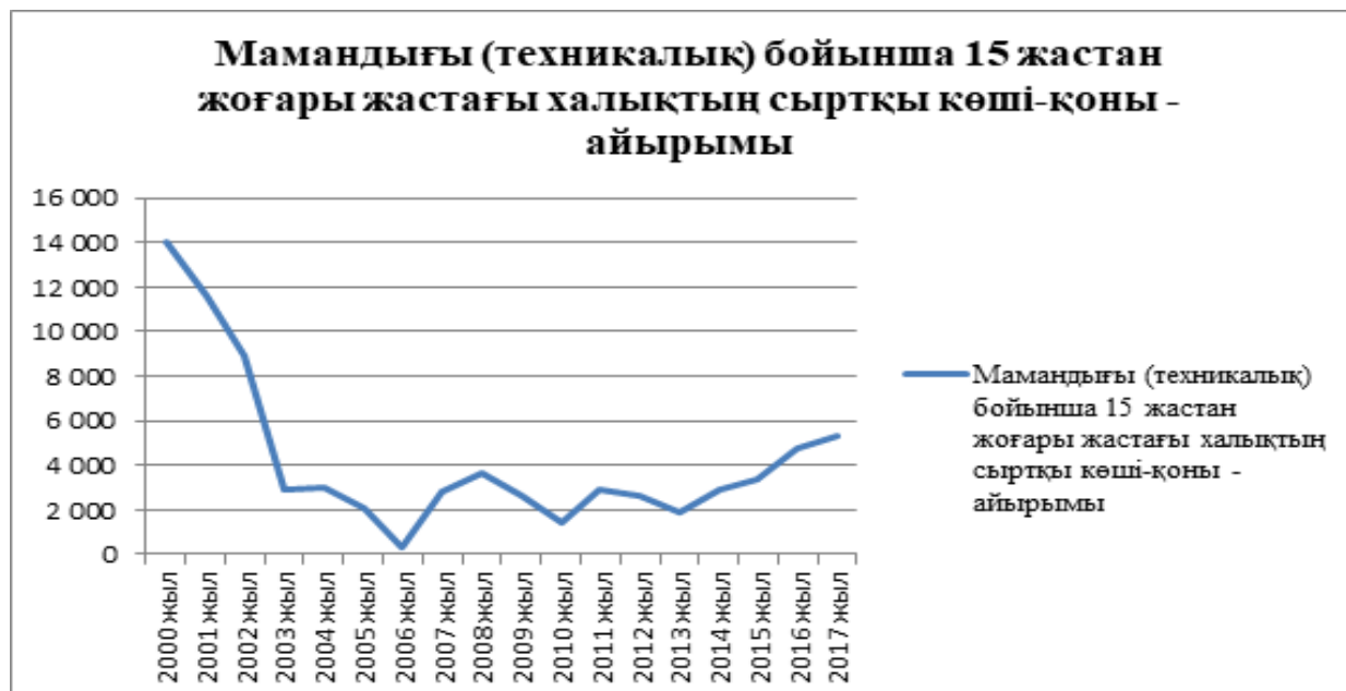
Сурет 3. Мамандығы (техникалық) бойынша 15 жастан жоғары жастағы халықтың сыртқы көші-қон айырымы

Техникалық сала мамандары 2000 жылы 13998 санды көрсетсе, қазіргі таңда 5293 болып отыр. Демек, әлі де интеллектуалды миграция процесінде техника саласының мамандарының ағыны күшті.