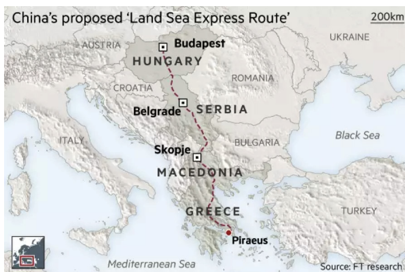
Figure 2 – China’s proposed “Land Sea Express Route”

The planned railway, which is supposed to cut the travel time between Belgrade and Budapest down to about three hours from the current eight, is also important to China in a practical sense. It comprises a crucial section of a so-called “Land Sea Express Route”, which China agreed in 2014 to build with Hungary, Serbia and North Macedonia. This route is aimed to link up with Piraeus, the Chinese-owned Greek port on the Mediterranean. Without the Serbian-Hungarian rail link, China could struggle to realise its aim of being able to export products by rail to Piraeus and thereafter by sea to destinations in Europe, Africa and beyond [4].