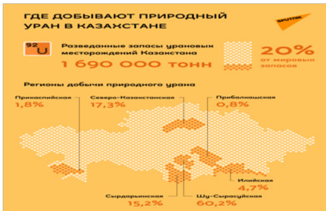
Приложение 4. Рисунок 4. Карта запасов природного урана в Казахстане.

Вместе с тем перспективным направлением в отношениях между нашими странами является взаимодействие в целях развития атомной энергетики в мирных и промышленных целях, в соответствии с положениями ДНЯО. Поскольку Казахстан является страной с большими запасами урана (почти 40% ежегодной мировой добычи), а Республика Корея – это страна, активно потребляющая и использующая атомную энергетику (в стране планируется увеличить долю атомной энергетики в общей доле энергетики до 56 % к 2021 году), то здесь вырисовываются широкие перспективы для двустороннего взаимодействия. Так, более трети потребляемого в Корее урана поступает именно из Казахстана [21]. Объем же добычи «Казатомпрома» в 2021 году сохранится на уровне менее 23 000 тонн урана [22] (См.прил.4., рис.4).