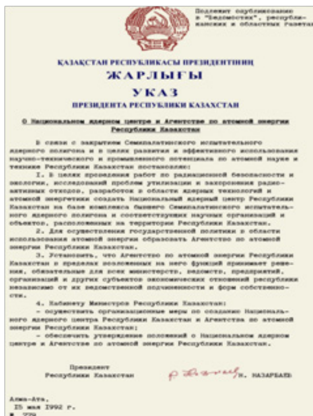
Приложение 3. Рис.3. Указ Президента РК за №779 «О Национальном ядерном центре и Агентстве по атомной энергии Республики Казахстан».15 мая 1992 года. https://www.nnc.kz/news/show/19

в мирных гражданских целях. Этому способствует тот факт, что наша страна сумела сохранить определенный научно-производственный и технико-экспертный потенциал, который стал работать в мирном русле сразу после закрытия полигона. Так, 15 мая 1992 года Указом Президента РК за №779 «О Национальном ядерном центре и Агентстве по атомной энергии Республики Казахстан» на базе комплекса бывшего Семипалатинского испытательного ядерного полигона и соответствующих научно-технических объектов создается Республиканское государственное предприятие «Национальный ядерный центр РК» (далее - РГП НЯЦ РК) [1].