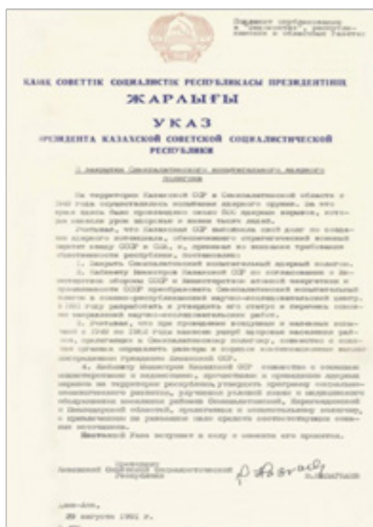
Приложение 2. Рис.2.Указ Президента Казахской ССР Н.Назарбаева от 29 августа 1991года «О закрытии Семипалатинского полигона». https://tengrinews.kz/userdata/images/u289/resized/671da3963874241a125fdaf9fe110d2f.jpg

И только свертывание советской ядерной программы в конце 1980-х годов, политика местных органов власти и активизация антиядерного движения «Невада-Семипалатинск» привели к прекращению ядерных испытаний и закрытию полигона, которая была юридически оформлена Указом Президента Казахской ССР Н.Назарбаева от 29 августа 1991 года «О закрытии Семипалатинского полигона» (См.прил.2, рис.2).