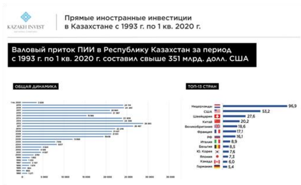
Рисунок 2. Национальный Банк Республики Казахстан

европейскими странами увеличился на 21,4% и составил $28,9 млрд. Доля экспорта составила $23,3 млрд, импорт - $5,7 млрд. При этом Казахстан планирует и дальше увеличивать объем взаимной торговли с ЕС [2].