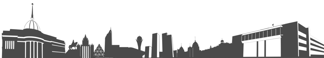
Рисунок 1 – Название рисунка