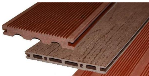
Рисунок 1. Древесно-полимерные композиты

Две первые системы могут применяться в бревенчатых или брусчатых домах и предполагают замену традиционных элементов стен бревнами и брусками из древесно-полимерных композитов (рис. 1).