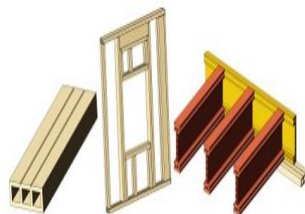
Рисунок 2. Доска, стеновая панель и конструкция перекрытия

Композиты могут применяться и в легкокаркасном домостроении. При этом возможна замена как элементов стен - досок или стальных тонкостенных профилей, - так и балок перекрытий (рис. 2).