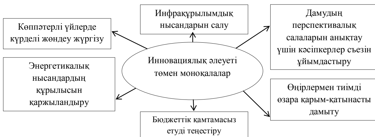
Сурет 1 - Үшінші топтағы моноқалаларда инновациялық әлеуетті қалыптастырудың негізгі бағыттары

Моноқалаларды дамытудың келесі перспективалық бағыты – мемлекеттік-жекеменшік әріптестікті ынталандыру. Оның шеңберінде екі аспектіні атап өткен жөн: қала құраушы кәсіпорынды қолдау шеңберінде мемлекеттік-жекеменшік әріптестік (МЖӨ) және моноқаланы дамытудың өзге салаларын қолдауға байланысты мемлекеттік-жекеменшік әріптестік. Бүгінгі күні ҚР-да көптеген моноқалаларында МЖӨ әлсіз дамыды. Бұл институционалдық ортаның бірқатар мәселелеріне, жобаларды іске асырудың табысты тәжірибесінің жоқтығына, аумақтың инвестициялық тартымдылығының төмендігіне байланысты болды. Моноқалалардың дамуын басқаруда келесі бағдар жергілікті басқару органдарының арасындағы ынтымақтастықтың тиімділігін арттыру болуы тиіс.