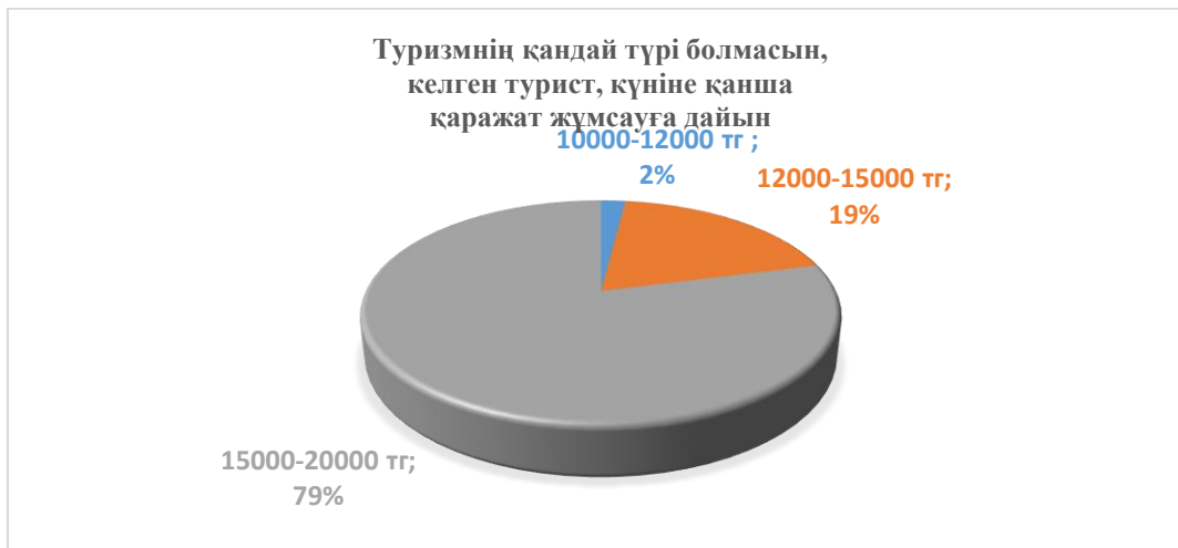
Сурет 3 – Респонденттердің аймақта қалу кезіндегі төлем қабілеттілігіне сипаттама Ескертпе – сауалнама нәтижесі негізінде автормен құрастырылған

Жоғарыдағы суретке сәйкес, келесідей қорытынды жасауға болады. Аймақта туризмнің түрлерін дамыту бойынша респонденттер арасында жағажай туризміне сұраныстың ең жоғары екенін көруге болады. 201 респонденттен 171 оңды жауап берген. Жағажай туризмін дамытуға негіз болатын өңірде Алакөл, Бұқтырма жағалауы, Зайсан көлі, Сібі көлі және Оқуньки демалыс аймағын айта аламыз. Осы аймақтарда туристердің қалу және туристік қызметтерге деген сұранысты арттыру үшін келесі сұраққа тоқталамыз.