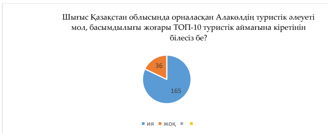
Сурет 5- Шығыс Қазақстан аймағының танымалдылығына респонденттердің берген жауабы Ескертпе – сауалнама нәтижесі негізінде автормен құрастырылған

Аймақтың туристік әлеуетінің жоғары бола алатыны туралы ғалымдардың еңбектерін де, зерттеулерін де кездестіреміз. Әйтседе, Шығыс Қазақстан облысының инфрақұрылымы өз деңгейінде дамымаған және инвестициялық салымдарды қажет етеді. Соған қарамастан «Шығыс Қазақстан облысында орналасқан Алакөлдің туристік әлеуеті мол, басымдылығы жоғары ТОП-10 туристік аймағына кіретінін білесіз бе?» деген сұраққа респонденттердің 82 %-ы (165 адам) ия, 18 %-ы (36 адам) жоқ деп жауап берді.