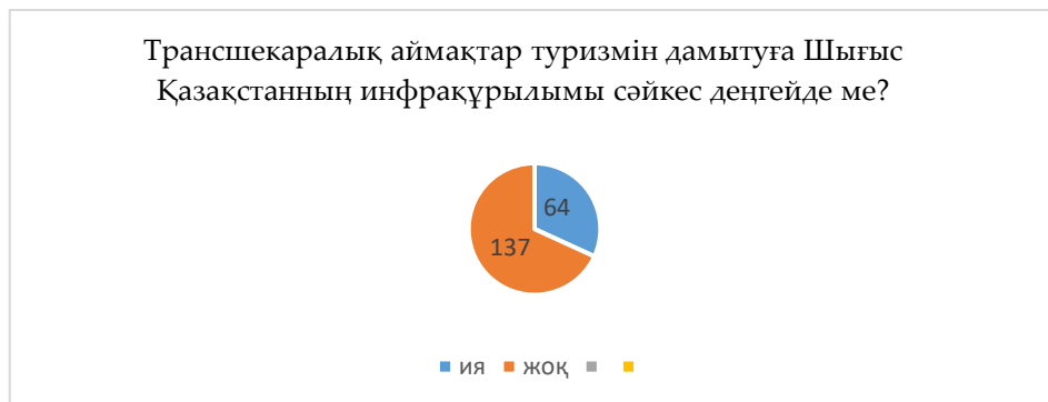
Сурет 4- Респонденттердің аймақтың инфрақұрылымына қатысты берген жауабы Ескертпе – сауалнама нәтижесі негізінде автормен құрастырылған

Аймақтың туристік әлеуетінің жоғары бола алатыны туралы ғалымдардың еңбектерін де, зерттеулерін де кездестіреміз. Әйтседе, Шығыс Қазақстан облысының инфрақұрылымы өз деңгейінде дамымаған және инвестициялық салымдарды қажет етеді. Соған қарамастан «Шығыс Қазақстан облысында орналасқан Алакөлдің туристік әлеуеті мол, басымдылығы жоғары ТОП-10 туристік аймағына кіретінін білесіз бе?» деген сұраққа респонденттердің 82 %-ы (165 адам) ия, 18 %-ы (36 адам) жоқ деп жауап берді.