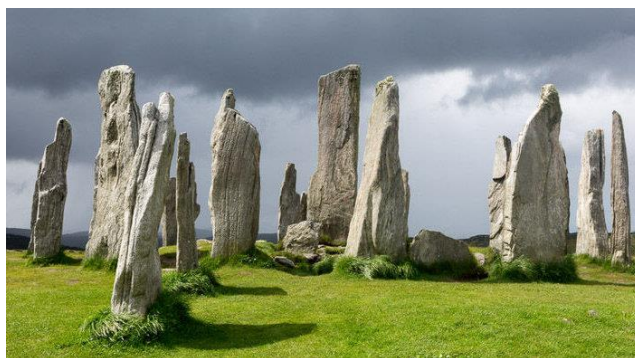
Рисунок 3. Каменный Круг Каслинг

Первые космические обсерватории существовали на орбите недолго, и программы наблюдений на них ограничивались несколькими пунктами. Современный космический телескоп - уникальный комплекс приборов, разрабатываемый и эксплуатируемый несколькими странами для гарантированной работы в течение многих лет. В наблюдениях на современных орбитальных обсерваториях принимают участие тысячи астрономов со всего мира.