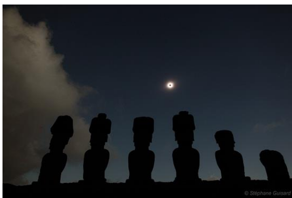
Рисунок 2. Мата-ки-те-Ранги

денствия и солнцестояния, то есть солнечная обсерватория. Энтузиастами относительно молодой науки археоастрономии были замечены еще некоторые любопытные факты, до того остававшиеся в тени. Так, на возможную связь со знаниями о звездах указывают топонимы, записанные русским путешественником Миклухой-Маклаем. Мата-ки-те-Ранги, что означает "Глаз неба" или Хити-Аи-Ранги, "Край неба" - так тоже называли свой остров местные жители (Рисунок 2). Было обнаружено, что ориентация некоторых статуй связана с такими явлениями как солнцестояния и равноденствия. Так, по преданиям местных жителей, статуи особым образом освещаются солнечными лучами, становятся как бы осмысленными, в дни июньского солнцестояния и сентябрьского равноденствия (соответственно, середина зимы и начало весны в Южном полушарии). перуанский Мачу-Пикчу [2].