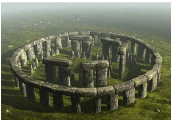
Рисунок 1. Стаунхендж

Стоунхендж - обсерватория, созданная еще в каменном веке. Она находится недалеко от Лондона. Это сооружение было одновременно и храмом, и местом для астрономических наблюдений - истолкование Стоунхенджа как грандиозной обсерватории каменного века принадлежит Дж. Хокинсу и Дж. Уайту (Рисунок 1).