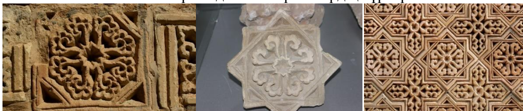
сурет – 2 [2]

Айша бибі кесене сыртындағы ою өрнектердің түрлері: