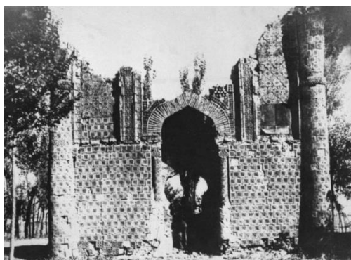
Сур. 1 Тарихи сурет Айша биби кесенесінің сақталған батыс бөлігі [1]

Танымал Айша биби кесенесі Тараз қаласының батыс жағында 18 км жерде Жамбыл облысы Айша биби ауылында орналасқан. Қазақстандағы басқа мемориалдық-дәстүрлік көркем ескерткіштер ішінде оған тең келетіні жоқ. Ескерткішті қалаған кірпіштердің ерекше әртүрлілігінің өзі таң қалдырады. Оның алғашқы қалпы біздің уақытымызға дейін тек батыс қабырғасында сақталған. 1953 жылы түсірілген тарихи суреттен аңғаруға болады [1].