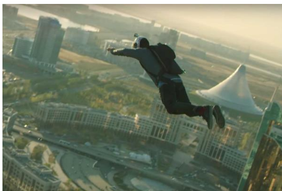
Сурет 2 Қазақстандағы экстрималды спорт түрлері

Дене шынықтыру - қазіргі заманның маңызды элементі. Ғалымдар спорттың көмегімен адамның стрессті жеңуге оңай екенін анықтады. Экстремалды спорт әлемде кеңінен таралған. Экстремалды спортпен шұғылданудың себептері әртүрлі. Кейбіреулер үшін экстремалды спортпен шұғылданудың себебі - өмір мен өлім шегінен тыс теңдестіруді қабылдау; басқа адамдар үшін бұл - өмірдің жоғары сезімін үнемі сақтап қалу мүмкіндігі. Кейбір жағдайларда экстремалды спортпен шұғылдану - бұл авто-агрессияның көрінісі (физикалық және психикалық салаларда өзін-өзі қорлауға бағытталған іс). Адамдардың экстремалды спортпен шұғылдануының себебі қандағы гормон адреналинінің босатылуы болып табылады, бұл эйфорияның сезімін тудырады. «Адреналиндік тәуелділік» сияқты нәрсе бар. Экстремалды спортпен шұғылдану кезінде күшті эмоцияларды сезінген адам осы жаттығуларды жалғастырады. Егер сіз осы спорт түрлерінің бірімен айналысуды шешсеңіз, онда қажет болған жағдайда барлық қажетті ақпаратты оқып шығыңыз, содан кейін инструктор дайындаңыз және медициналық тексеруден өтіңіз, өйткені бұл сала барлық адамдарға арналмаған. Велоспорт, велосипедпен жүру, виндсерфинг, велосипед мото-кросс (BMX), шаңғымен сырғанау, граффити бомбылау, сүңгу, парапланеризм, шабуылдау, шорт серуендеу, шаңғымен сырғанау, каякинг, ұзындықты секіру шаңғымен сырғанау, сноуборд, сноуборд, сноуборд, спелеология, трюк, сынақтар, серфинг, күрес түрлерімен айналысады [3].