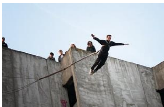
Сурет 3 Қауіпті экстрималды спорт түрлері

Дене шынықтыру - қазіргі заманның маңызды элементі. Ғалымдар спорттың көмегімен адамның стрессті жеңуге оңай екенін анықтады. Экстремалды спорт әлемде кеңінен таралған. Экстремалды спортпен шұғылданудың себептері әртүрлі. Кейбіреулер үшін экстремалды спортпен шұғылданудың себебі - өмір мен өлім шегінен тыс теңдестіруді қабылдау; басқа адамдар үшін бұл - өмірдің жоғары сезімін үнемі сақтап қалу мүмкіндігі. Кейбір жағдайларда экстремалды спортпен шұғылдану - бұл авто-агрессияның көрінісі (физикалық және психикалық салаларда өзін-өзі қорлауға бағытталған іс). Адамдардың экстремалды спортпен шұғылдануының себебі қандағы гормон адреналинінің босатылуы болып табылады, бұл эйфорияның сезімін тудырады. «Адреналиндік тәуелділік» сияқты нәрсе бар. Экстремалды спортпен шұғылдану кезінде күшті эмоцияларды сезінген адам осы жаттығуларды жалғастырады. Егер сіз осы спорт түрлерінің бірімен айналысуды шешсеңіз, онда қажет болған жағдайда барлық қажетті ақпаратты оқып шығыңыз, содан кейін инструктор дайындаңыз және медициналық тексеруден өтіңіз, өйткені бұл сала барлық адамдарға арналмаған. Велоспорт, велосипедпен жүру, виндсерфинг, велосипед мото-кросс (BMX), шаңғымен сырғанау, граффити бомбылау, сүңгу, парапланеризм, шабуылдау, шорт серуендеу, шаңғымен сырғанау, каякинг, ұзындықты секіру шаңғымен сырғанау, сноуборд, сноуборд, сноуборд, спелеология, трюк, сынақтар, серфинг, күрес түрлерімен айналысады [3].