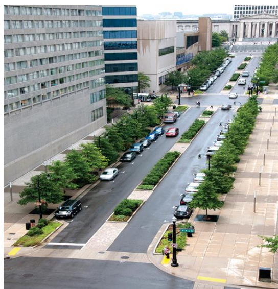
2 сурет. Жол-көлік жүйесі