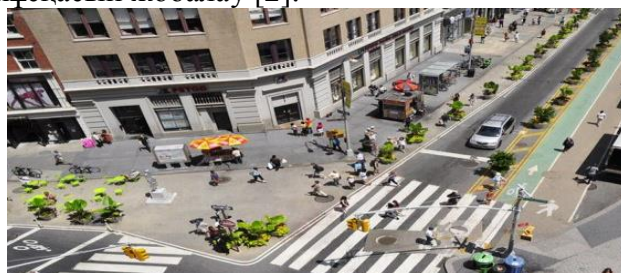
1 сурет. Қаланың құрылысы