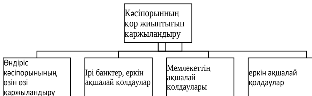
2 - сурет. Кәсіпорынның қор жиынтығын қаржыландыру көздері мыналар

Кәсіпорынның қор жиынтығын қаржыландыру көздері бүгінгі күні тәжірибеде нақтылай дағдыланып бейнеленген. Өндірістік кәсіпорындарда негізгі қаржы көздері өндірісті ұлғайтуға, өндірістік процесстерді үздіксіз жүргізуге қажетті инвестициялық салымдарға бағытталады. Кәсіпорында пайда табу бағытындағы салымдар инвестициялау деп аталынады. Инвестицияның негізгі көлемі өндірістік процесстерді жүргізуге жағдай жасайды және тиімді бұйым шығаруға, қызмет көрсетуге жұмсалады. Инвестиция кәсіпорынның қор жынтығын қаржыландырудың негізгі құралы болып табылады. Нақтылай кәсіпорынның қор жиынтығын қаржыландыру көздері 2 - суретте көрсетілген.