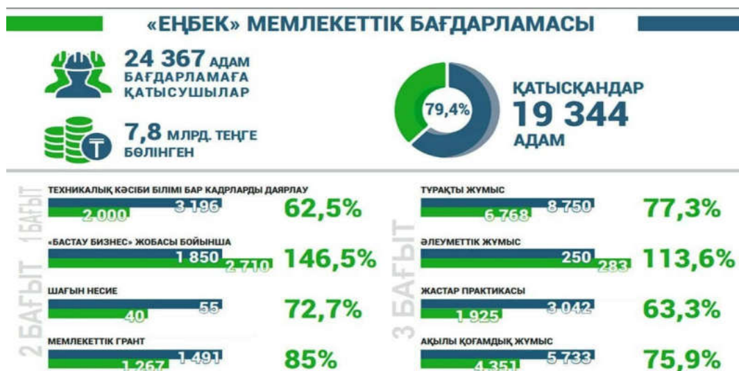
3 - сурет. «Еңбек мемлекеттік бағдарламасы» бойынша қорытынды көрсеткіш

«Еңбек мемлекеттік бағдарламасы» өндіріс кәсіпорындарынан бастап, шағын және орта бизнес кәсіпкерлерін қолдау мақсатында жасалған, мемлекеттік қаржыдан белгілі мөлшерде қаржы бөлініп 25000-ға жуық адамды қамтыған мемлекеттік бағдарлама.