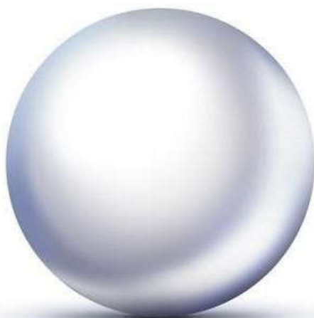
Сурет-3. Жарықтандыру мен көлеңке көлем береді

жарықты 3-ші суретте көрсетілгендей күн шуақты ауа райында, қараңғыда көше шамдары немесе сәулелердің өте тар шоғырын құрайтын арнайы жасанды бағытталған жарық көздері қамтамасыз етеді.