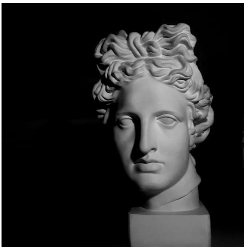
Сурет-1. Авторы: Дамыс Жансая «Аполлон»

Өңдеу кезінде жарық пен көлеңкені қалай реттеуге болады: Көбінесе жарық пен көлеңкенің дұрыс балансын алу қиын. Мұнда жақсы өңдеу бағдарламалық құралы кіреді. Мысалы, Adobe Lightroom бағдарламасында жарық пен көлеңкені реттеу оңай. 2-ші суретте көрсетілген дейкескіннің тамаша композициясы үшін бөлектеу және көлеңкелерді тереңдету немесе жеңілдету үшін жеке сырғытпаларды жай ғана жылжытыңыз.