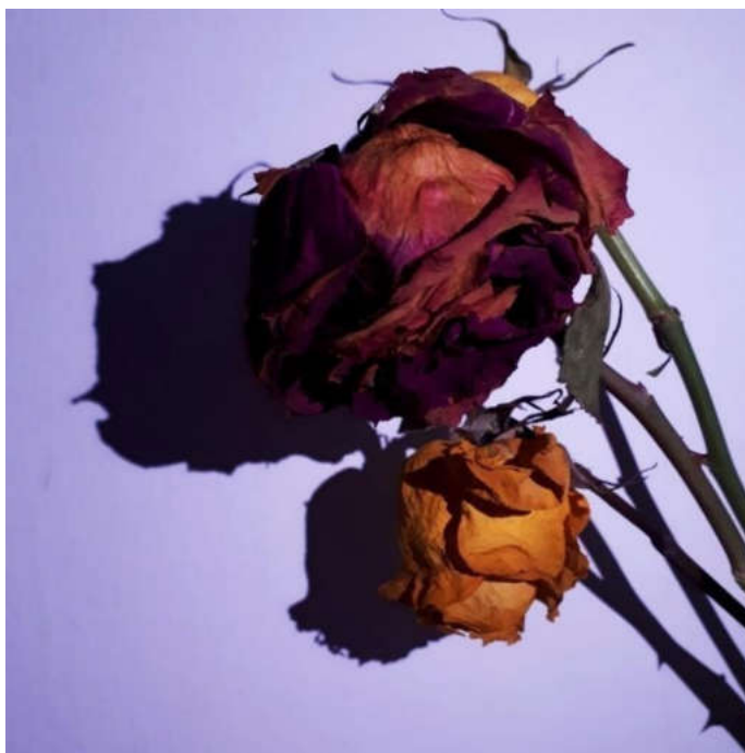
Сурет-2. Авторы: Дамыс Жансая «Әсемдік»

Өңдеу мүмкіндігіңіздің құлпынашу үшін кейбір тамаша фотосурет кеңестерін табыңыз, содан кейін Lightroom көмегімен өңдеу ойынын бүгінде жақсарту үшін не істей алатыныңызды зерттеңіз.