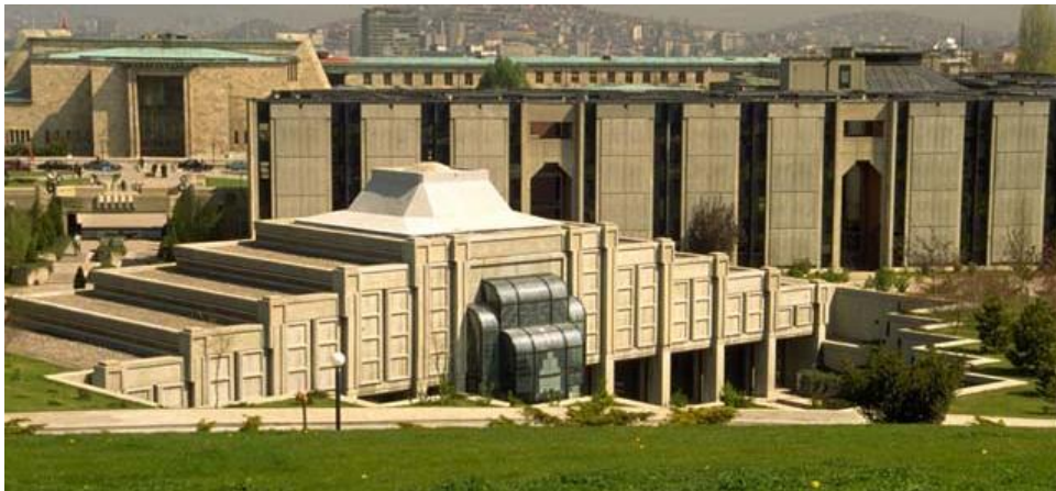
Сур.1 Ұлттық Ассамблеяның бас мешіті, Анкара, Түркия, 1989

Еуропа мен Америкадағы шіркеулердің көбісі босап жатыр немесе қымбат мектептер мен лофттерге айналдырып жатса, мұсылмандар бұрынғы супермаркеттерде, түнгі клубтар, іске аспаған шіркеулерде мешіттер сала бастады. Мұсылмандар бай, өздеріне деген сенімі артып, географиялық жағынан шашыраңқы орналаса бастайды.