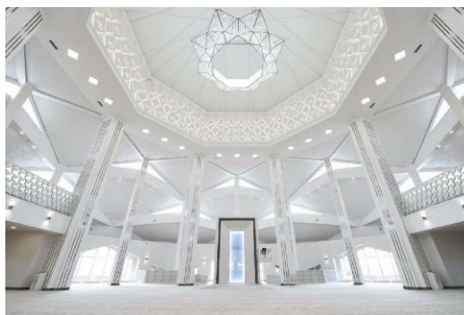
Сур.6 «Алланың Гүлі» мешітінің интерьері, Астана, 2018