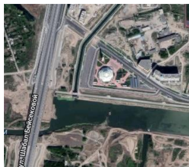
Сур.2 «Алланың Гүлі» мешітінің орналасуы

Мешіттің ауданы 3 695 шаршы метрді құрайды, ал алаңның алаңы - 1,44 гектар. Күмбездің диаметрі 20 метр, ғимараттың диаметрі 53 метр, биіктігі 26 метр. Мешіттің солтүстігінде қасиетті қылшақ тәрізді «Қалам» мұнарасы салынған. Оның биіктігі 43,5 метр. Намаз залы 2 248 шаршы метрді құрайды және 750-1000ға жуық келушілерді сыйдыра алады (Сур. 3).