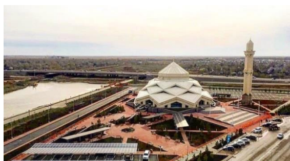
Сур.4 «Алланың Гүлі» мешіті, Астана, 2018