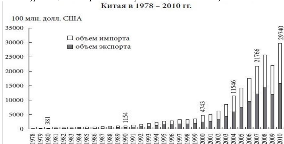
Сурет 1. ҚХР экспорт және импорт көлемі (1978-2010 жж.)

Жапон-қытай дипломатиялық қарым-қатынасының қалпына келуі екі елдің арасындағы экономикалық байланыстың дамуына да көбірек ықпалын тигізді. 1974 жылы бесінші қаңтарда Жапония сыртқы істер министрі М.Охираның Пекинге келуі кезінде сауда келісіміне қол қойысты. Онда ғылыми-техникалық айырбас жөнінде бір-біріне мол ақпарат беру қарастырылды. Екі ел арасында экспорт, импорт көлемі ұлғая түсті. ҚХР жапон тауарының нарықтық жинағы бойынша АҚШ-тан кейін екінші орынға кірді.