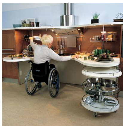
Рисунок 2 – Инклюзивный пример создания кухонной зоны

Оборудование санитарно-технических узлов, кухонь для инвалидов. Оборудование следует устанавливать в такой последовательности, в какой оно перечислено. Плита, рабочий стол и мойка должны допускать подъезд под них инвалидной коляски. С этой целью высота в свету под ними должна быть не менее 69 см (Рисунок 2).