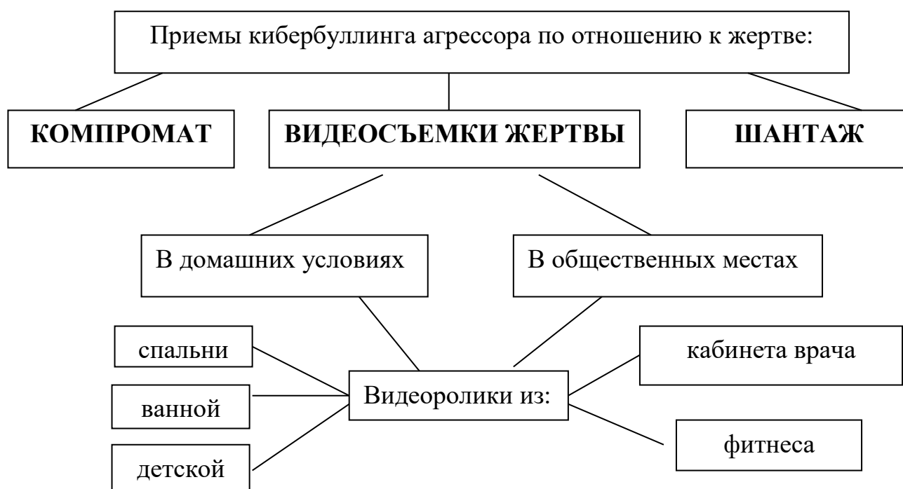
Схема № 1 «Приемы кибербуллинга в системе отношений агрессор—жертва»

Начинаются отношения между агрессором и жертвой как в классическом Шекспировском произведении, с Гамлетовского «быть или не быть», и, только потом все переходит в плоскость «репутация или деньги», в связи с щепетильной ситуацией кибербуллинга