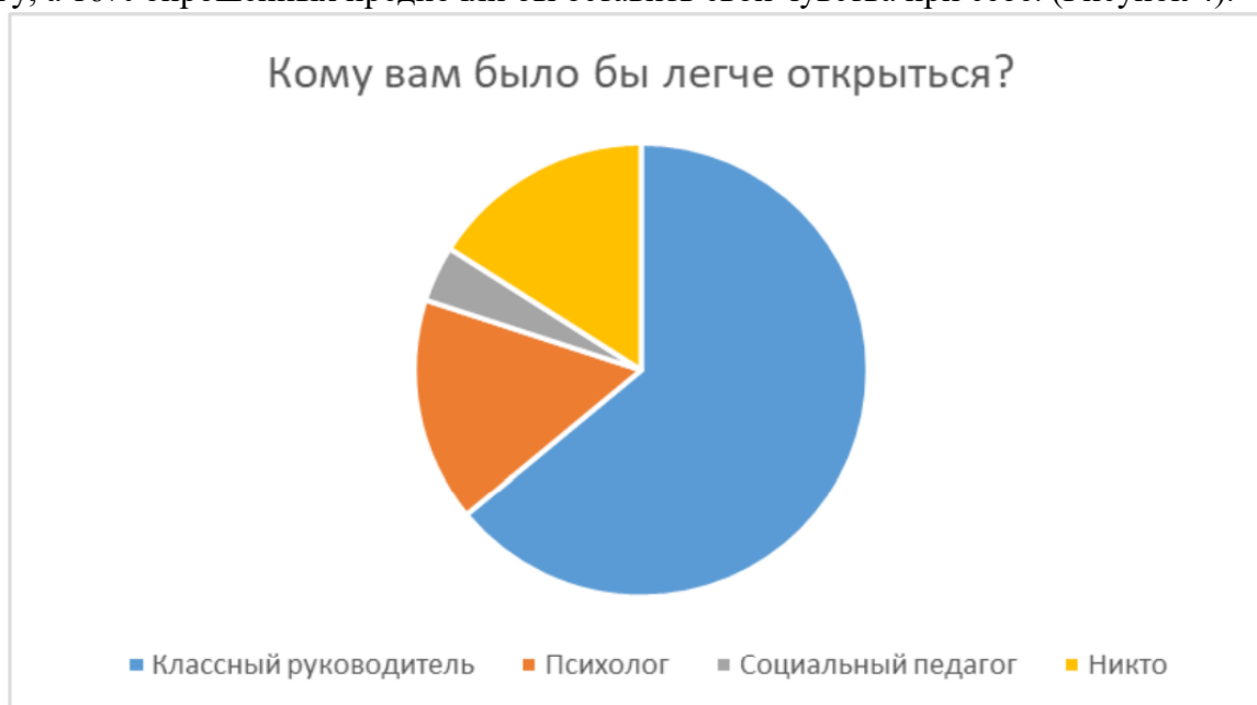
Рисунок 4. Кому вам было бы легче открыться?

Последний показатель отражает тех, кому бы учащиеся легче открылись. Большинство учеников, а именно 64%, предпочли бы классного руководителя. 16% учеников было бы легче открыться психологу, 4% обучающихся смогли бы довериться социальному педагогу, а 16% опрошенных предпочли бы оставить свои чувства при себе. (Рисунок 4).