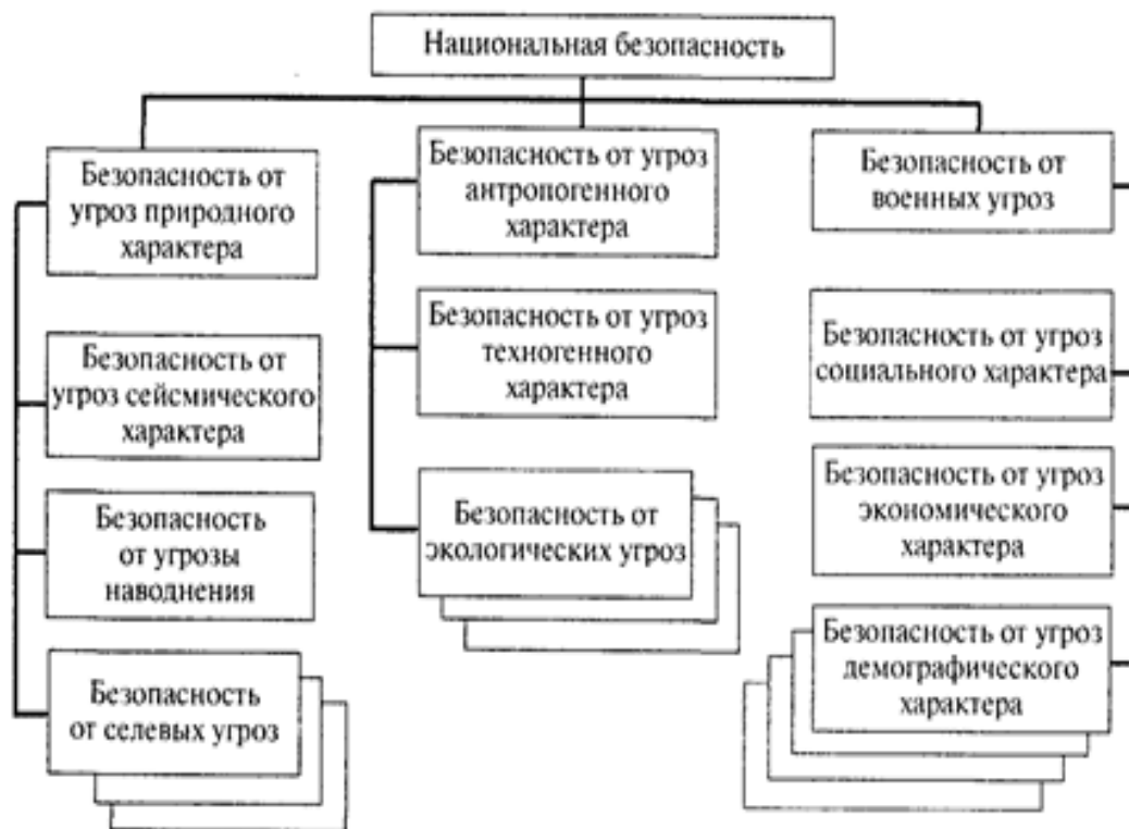
Рисунок 1. Подпункты национальной безопасности Южной Кореи

Внутренняя безопасность – это защищенность государства от междоусобиц, войн, недопониманий, споров и других конфликтных ситуаций на территории государства.