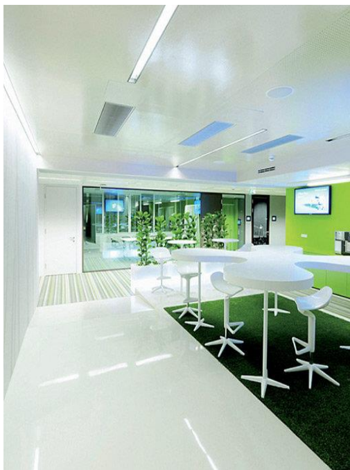
Рисунок 2. Интерьер офиса компании Microsoft Corporation в Вене (Австрия)

всю презентационную технику. Иногда зона для совещаний с целью экономии пространства располагается в кабинете руководителя. Но в таком случае кабинет делится на две части – официальную и неформальную, где обязательно есть кресла и журнальный столик. Для функционального и удобного кабинета топ-менеджера достаточно 12м 2 . Но чаще размеры кабинета выбираются, исходя из имиджевых соображений.