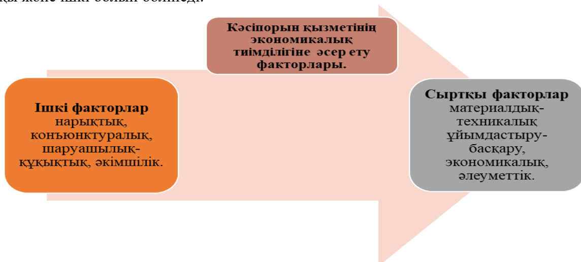
Сурет - 2. Кәсіпорын қызметінің тиімділік факторлары

Кәсіпорын қызметінің экономикалық тиімділігіне әсер ету факторларының көптеген жіктелуі белгілі. Кәсіпорын қызметінің экономикалық тиімділігіне әсер ететін бұл факторлар сыртқы және ішкі болып бөлінеді.