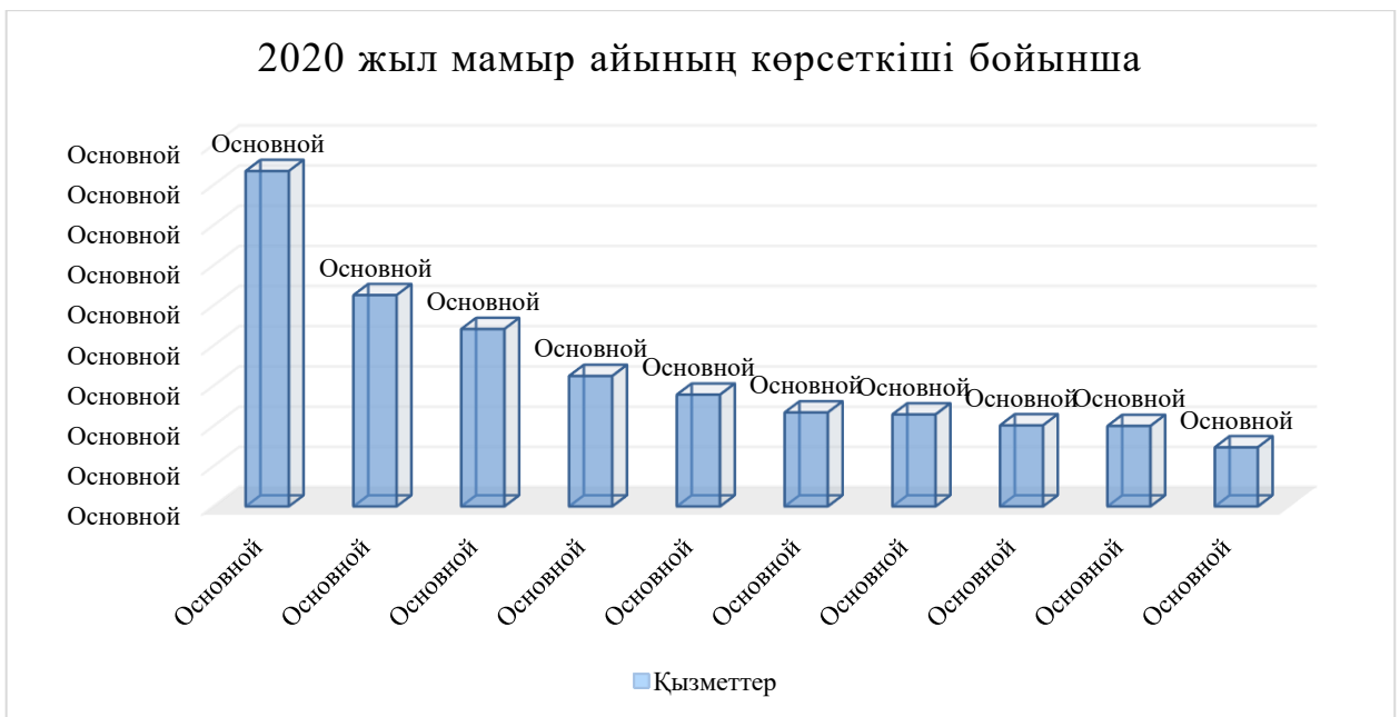
Сурет 1. 2020 жылдың мамыр айындағы көрсеткіштері бойынша Электронды үкімет порталының пайдаланушылары

Ескерту – [5] дерек көзі бойынша құрастырылды