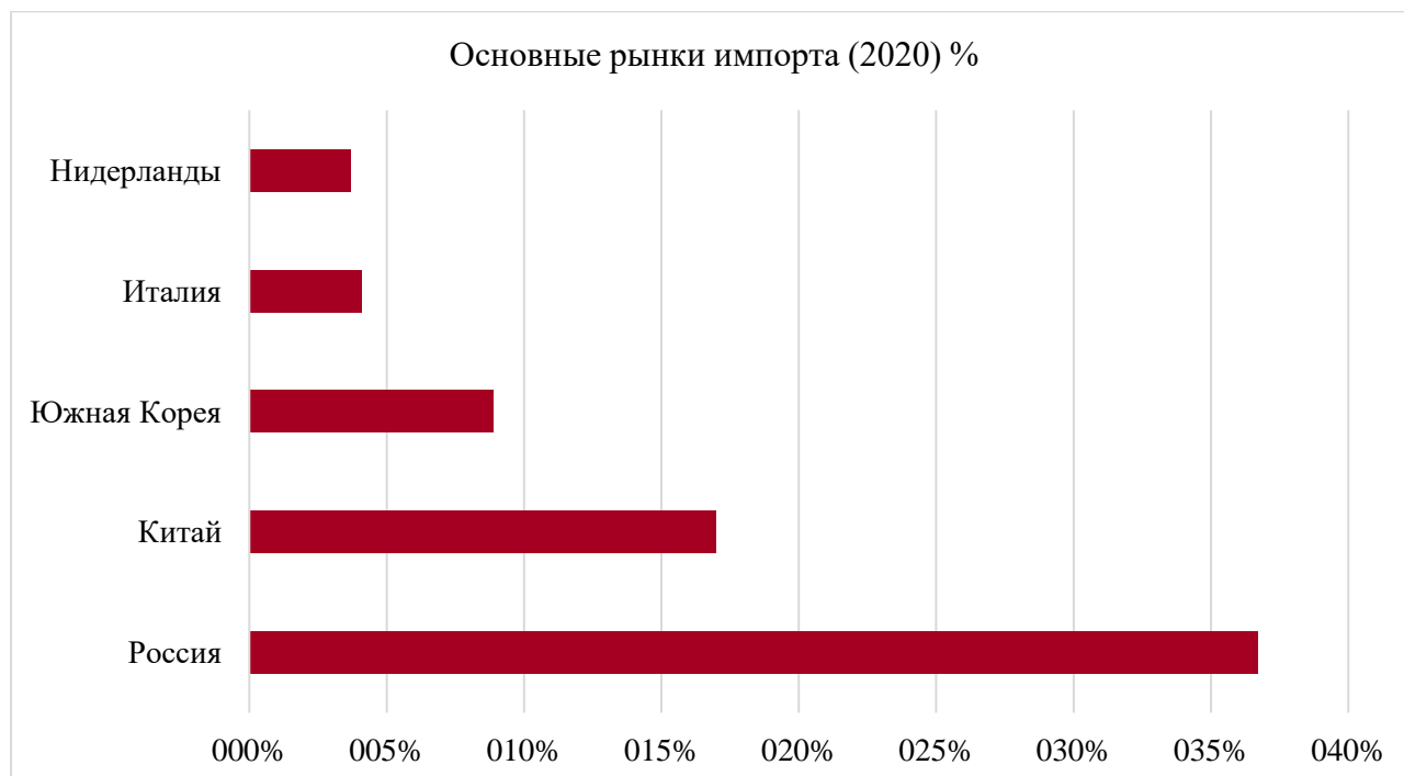
Рисунок 2. Основные страны-импортеры (2020)

В Казахстане запущена система временного ввоза Карнета АТА. Эта система позволяет беспошлинно осуществлять временный ввоз и вывоз товаров для конкретных целей. Существуют различные антидемпинговые меры, введенные в отношении продукции из Украины, автозапчастей и металлопродукции из Китая и других стран, а также легких легковых автомобилей из Италии и Германии.