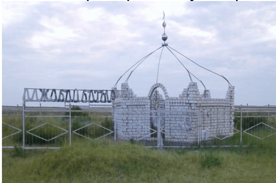
Мазар Олжабай батыра

Олжабай батыр - выходец из рода Аргын Среднего жуза. Славный воин родился в 1709 году. Его предок Айдабол в свое время был бием. Отец Олжабая Толыбай погиб в годы великого бедствия «Ақтабан шұбырынды, Алқакөл сұлама», защищая народ от джунгарского нашествия. На тот момент Олжабаю было тринадцать лет, он воспитывался у нагашы (дядя по материнской линии) Каратай батыра. С юных лет Олжабай проявлял отвагу. Повзрослев, он защищал родные земли, участвовал во многих битвах с джунгарами. В сражении с джунгарами в отрогах Баянаульских гор Олжабай батыр проявил героизм. Вместе со своим племянником Жасыбай батыром он устроил засаду на пути врага. Сарбазы Жасыбай батыра находились у перевала Шойынколь, а Олжабай батыр со своими воинами – у перевала на озере Торайгыр. Войска противника напали на войска Жасыбай батыра. В этом сражении погиб Жасыбай батыр. Олжабай умер в 1783 году. Мазар Олжабай батыра находится близ аула Олжабая батыра в Ерейментауском районе [4].