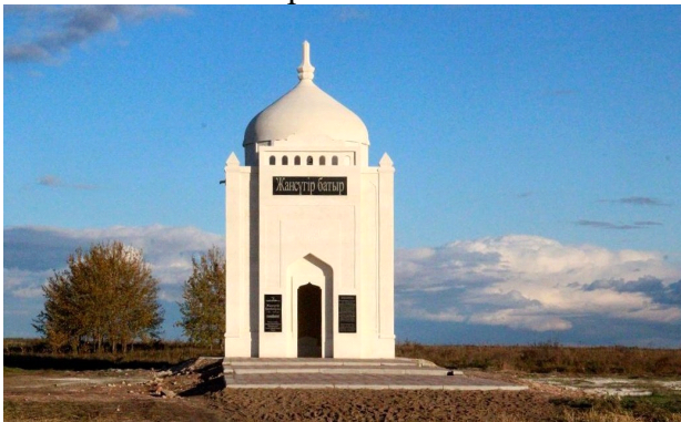
Кумбез Жансугур батыра

Жители села Аралагаш Аккайынского района гордятся мазаром Жансугур батыра. Он родился в 1742 году, а умер в 1832 году. С 15 лет он возглавлял отряд казахских воинов против джунгарских захватчиков. Отряд, который возглавил Жансугур батыр, достиг больших побед в сражениях против калмыков. Похоронен батыр у озера, недалеко от села Аралагаш Аккайынского района СКО. Могила считается святым местом [5, с.155].