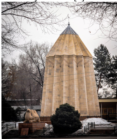
Мавзолей Раимбек Батыра

Широко известным сакральным мемориалом у казахов является памятник великому казахскому батыру Раимбеку, который сражался за свободу казахов от джунгарских захватчиков, он расположен в городе Алматы вдоль одноимённого проспекта Райымбека. Памятник имеет необычную форму, в виде остроконечного шатра с полумесяцем на вершине, внутри которого находится саркофаг с прахом великого героя. Также на территории мавзолея расположен источник с водой и помещение для совершения молитв. Как говорится в легенде, Райымбек Батыр перед смертью собрал всех соратников и близких людей и сказал: «В случае моей смерти заверните мое тело в кошму, погрузите на белого верблюда, и где возляжет верблюд, там и схороните меня». На том месте, где верблюд, остановился воздвигнут мавзолей со скульптурой белого верблюда. С тех пор в народе, это место считается святым, люди приезжают с разных частей Казахстана и всего мира, прося благословения у святого [3].