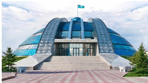
Рисунок 8. Историко-культурный центр Первого Президента

Историко-культурный центр Первого Президента – хранитель истории жизни лидера нации Н.А. Назарбаева (рис.8).