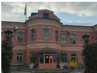
Рисунок 7. Восточно-Казахстанский областной архитектурно-этнографический и природно-ландшафтный музей-заповедник

Восточно-Казахстанский областной архитектурно-этнографический и природно-ландшафтный музей-заповедник - одна из действующих культурных площадок, на основе которой проводится большое количество разнообразных мероприятий, служащих для интересного проведения досуга в Усть-Каменогорске (рис.7).