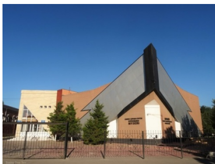
Рисунок 4. Южно-Казахстанский областной музей жертв политических репрессий

Южно-Казахстанский областной музей жертв политических репрессий - это память трагического периода. Этот музей был открыт в 2001 году, в честь 10-летия независимости Казахстана (рис.4).