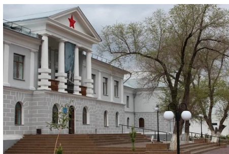
Рисунок 3. Музей памяти жертв политических репрессий Карлаг

Музей был создан в 2002 году по поручению первого президента - Нурсултана Назарбаева. В фондах музея находится огромное количество экспонатов: различные фотографии, документы, а также и личные вещи заключённых Карлага. Если говорить об истории Карагандинского исправительно-трудового лагеря, он был создан в декабре 1931г. Одной из целей создания Карлага было создание крупной продовольственной базы для индустриальных центров. Заключённые тут являлись, так скажем, бесплатной рабочей силой. Репрессиям чаще всего подвергались религиозные служители, интеллигенция, офицеры, крестьяне. В разное время заключёнными Карлага было также много известных учёных, среди них и востоковед Лев Гумилёв. В марте 1951 года он был сослан в карлаговскую пересылку на станцию Карабас на полгода. Карлаг, можно сказать, был своеобразным государством в государстве со своими воинскими формированиями, железнодорожными станциями, типографиями. К сожалению, точной цифры погибших заключённых Карлага нет, но известно, что счёт идёт на десятки тысяч человек: это более полутора тысяч справок на расстрелянных; ещё больше погибших от болезней и рук лагерной охраны.