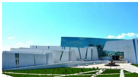
Рисунок 6. Национальный музей Республики Казахстан

Национальный музей Республики Казахстан - это самый молодой и самый крупный музей в Центральной Азии. Был открыт 9 июля 2015 года (рис.6).