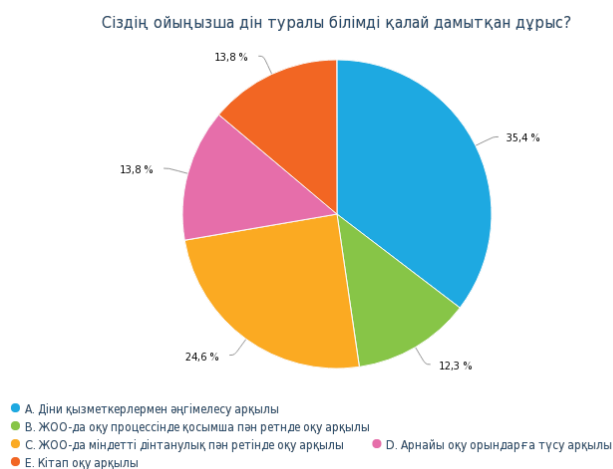
Диаграмма 5. Сіздің ойыңызша дін туралы білімді қалай дамытқан дұрыс?

Жоғарыдағы диаграмманың көрсеткіштеріне сүйене отырып, қазіргі жастардың басым бөлігі (12,8%) дін туралы білімді жоғарғы оқу орында оқу процессінде қосымша пән ретінде жүргізілгенін қалайтындығын білдірді, сонымен бірге, жастардың келесі бөлігі (34,5%) дін туралы білімді діни қызметкерлермен әңгімелесу арқылы жоғарылатуды дұрыс деп табатындықтарын айтты. Ал респонденттердің 13,8% дін туралы білімді кітап оқу арқылы кеңейтуді дұрыс деп тапса, 24,6% респондент дін туралы білімді жетілдіру үшін жоғарғы оқу орындарда арнайы пән ретінде оқылса деген ниет білдірді. Дін туралы білімді жетілдіру үшін арнайы діни оқу орындарға түсу арқылы жоғарылатуды көздеген респонденттер саны 13,8% құрады.