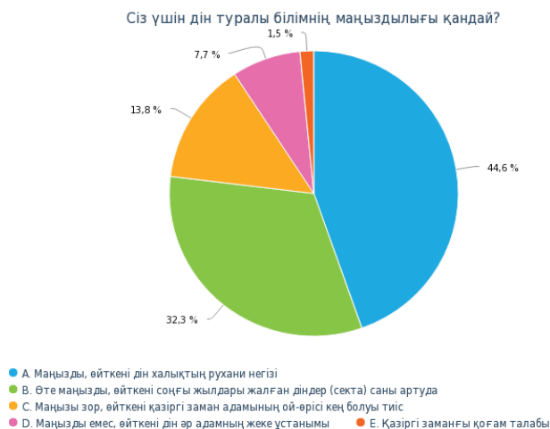
Диаграмма 4. Сіз үшін дін туралы білімнің маңыздылығы қандай?

Диаграммада көрсетілген зерттеу нәтижесінің көрсеткіштеріне талдау жасайтын болсақ, қазіргі жастардың басым көпшілігі (44,6%) дін туралы білімнің маңыздылығын дін