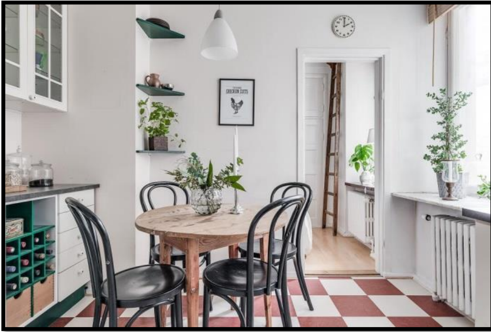
Сурет 2. Скандинавия стиліндегі интерьер үлгісі

Бұл тенденцияның тағы бір ерекшеленетін ерекшелігі – бұл табиғилық. Ең жақсысы, егер бөлмеде нақты ағаштан жасалған жиһаз болса, тоқыма зығырдан, мақтадан немесе жібектен жасалған. Минимализмге қарамастан, әр интерьер жеке болуы керек, отбасылық фотосуреттер, қолдан жасалған аксессуарлар, қабырғадағы плакаттар осы қасиетке ие. Бұл «декор үшін декор» емес, иелердің мінезін көрсететін пайдалы нәрсе болуы маңызды. Скандинавия стилінде ашық түстер басым болуы керек болғанына қарамастан – ақ, ақшыл сұр және ақшыл көк, яғни жарқын екпіндер интерьерге жаңа кейіп сыйлай алады.