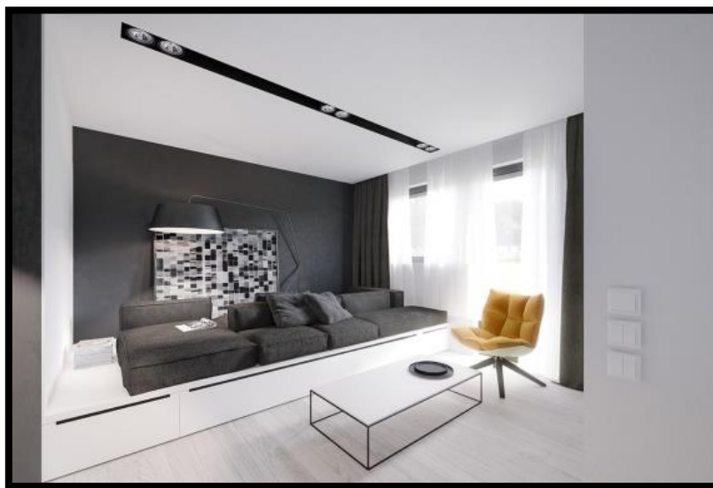
Сурет 5. Минимализм стилі стиліндегі интерьер үлгісі

бірқалыптылығы және сыртқы атрибуттарды қажет етпейтіндіктен және осы ортадағы тыныштық пен тәртіптің қалайтындығын қанағаттандыруға оңтайландырылып ұйымдастырылады.