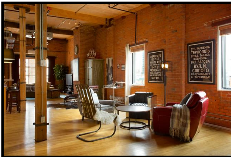
Сурет 3. Лофт стиліндегі интерьер үлгісі

Лофт стилі ерекше тұлғаларды, еркіндік пен кеңдікті сүйетіндерді ерекшелендіреді. Дәл осы бағытта иесінің жеке ерекшеліктерін атап өтуге болады, өйткені стильдің немқұрайлылығы қиялға жетуге мүмкіндік береді.