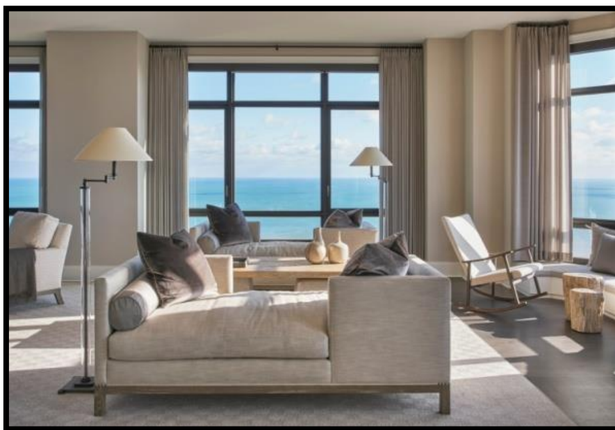
Сурет 4. Контемпорари стиліндегі интерьер үлгісі

Контемпорари стиль – қарапайымдылық, ұстамдылық және функционалдылық. Мұндай бөлмелердің интерьерлерінде жасанды материалдар мен қарапайым пішіндер қолданылатындығына байланысты, оны аз бюджетпен жасауға болады.