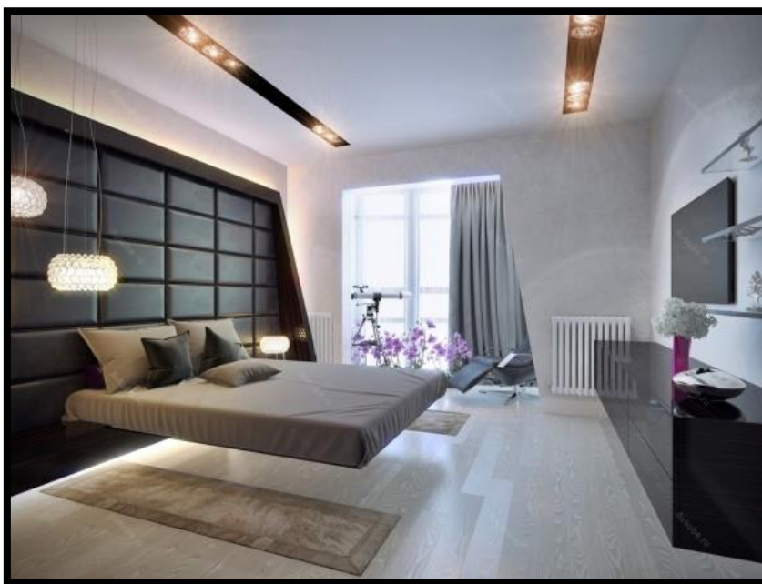
Сурет-7. Хай-тек стили

Интерьердегі жоғары технологиялар – бұл техника мен технологияның маңыздылығы. Бұл стиль басым болатын үйлерде экрандар, мониторлар, сенсорлар, басты рөлден басқа, эстетикалық да рөл атқарады. Олар бөлмені ежелгі жылдардағыдай безендірді, олар сурет багеталары мен гипс қалыптарын безендірді.