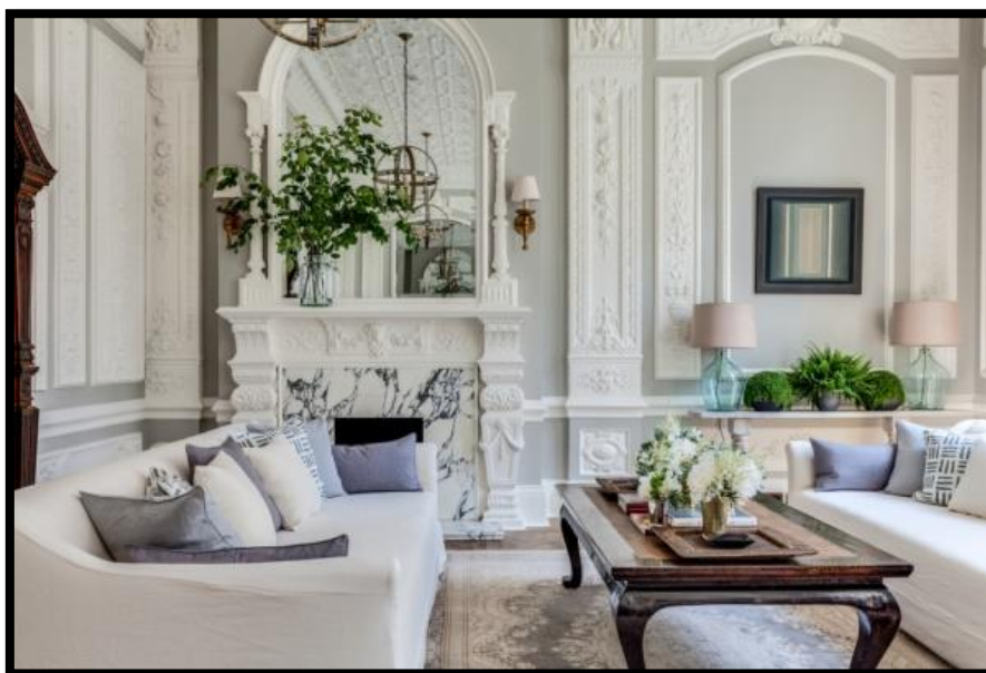
Сурет 1. Классикалық стиліндегі интерьер үлгісі

Қабырғаларды безендіру ең алдымен ұқыпты болуы керек. Бұл тегіс тұсқағаздар және лаконикалық өрнектері бар жабындар болуы мүмкін: жолақтар, монограммалар және басқа да әшекейлер. Төбесі, әдетте, шыбықпен безендірілген, бірақ егер үйінде өте төмен төбелер болса, шыбықпен қалыптау мен декорды мұқият қарастырған жөн, оны тегіс қалдырған дұрыс. Еден әдетте ағаштан жасалған. Әрине, табиғи паркет жақсы көрінеді.