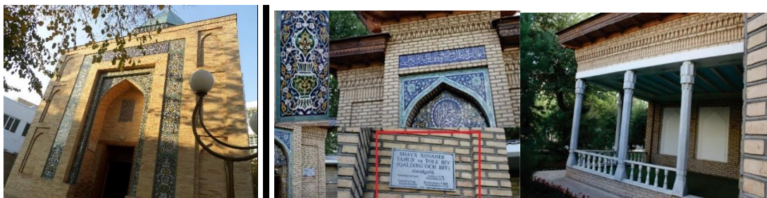
Төле би кесенесі. Ташкент қаласы «Төле Би» аты жазылған тақташа Төле би мешіті. Ташкент қаласы