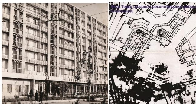
Өзбекстан бойынша жобалық және конкурстық жұмыстар. Ташкент

Осындай белсенді творчестволық еңбектерінің арқасында ол Орта Азияның, оның ішінде Өзбекстанның көне және заманауи құрылыс өнерінің принциптерін жетік меңгерді. Анау Александр Македонский, парсы-соғды, араб, көне түркі кезеңдерінен бастап мұндағы қалалар қалай қалыптасты, тұрғындардың этникалық құрамы қандай болды, осының бәріне кейіпкеріміз қызығушылық танытты. Әрине, бұл өңірдің мәдениетінің қалыптасуы әуелі ауа-