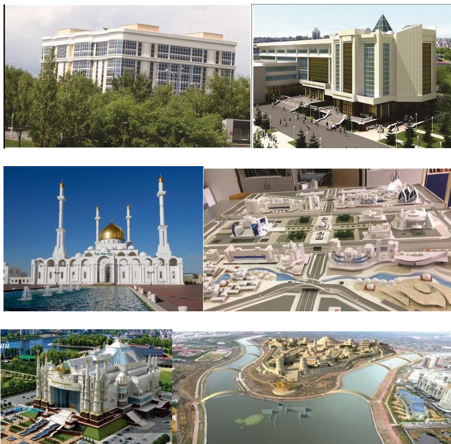
Жобалық және конкурстық жұмыстар. Астана

5. Ұстаздық ету кезеңі. Л.Н. Гумилев атындағы Еуразиялық Ұлттық Университетіміздің «Сәулет» кафедрасында бірге жұмыс істеу барысында, әріптесіміздің сәулет өнерінің нағыз қас шебері екеніне көзіміз жетті. Оған дәлел авторлық жобалары: қаламыздағы Нұр-Астана мешіті, Нейрохирургия кешені, «Алатау» тұрғынүй кешені, университетіміздің Сәулет-құрлыс факультетінің оқу корпусы, ЭКСПО-2017 концептуальдық жобасы, Түркістан қаласының жаңа орталығының концепциясы, астанаға арналған «Шығыс қаласы» тұрғын ауданының конкурстық жобалары мен басқада көптеген туындылары. Көптеген конкурстық жобалардың лауреаты. Мұндай ірі творчестволық жұмыстарда жанындағы студент-шәкірттерін сәулет өнеріне баулып отыратын ұжымымыздағы ең тәжірибелі архитектор деп білеміз. Жандарбек Мәлібекұлы жұмыс үстінде күрделі симфониялық музыка композиторы іспетті көрінеді. Оның қолында небір жеке геометриялық пішіндер, гармониялық заңдылықпен көркем үйлесіп, қаласалу немесе архитектуралық нысандарға айналалып шыға келеді.