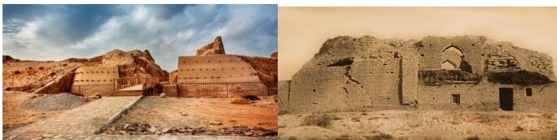
Сыгнақ. Кіріберіс қақпасының фрагменті Сыгнақ мешітінің қалдығы

Ауыл балаларымен жиі-жиі асыр салып ойнайтын жерінің бірі, қазақ хандығының бір кездегі астанасы болған, іргелес жатқан, Сығнақ қаласының орны. Оның балаларды тартып тұратын ерекше қасиеті болатын. Қалқиып тұрған қала қорғанының қалдықтары, сәл байқалатын иілген қала көшелерінің іздері, шөгіп қалған үйлердің қабырғалары, олардың арасында ара-тұра кездесетін қыш кірпіштен салынған, кезінде еңселі ғимараттардың орындары ғажап бір көңіл-күй тудыртын орта болатын. Ойын балаларының тағы бір қызығатындары – осында табылатын асық-сақалар. Кәдімгі қазақ балалары, өздері егеп, қорғасын құйып жасайтын сақалар. Бірақ бұл сақалар ерекше үлкен (архарлардың асықтарынан болу керек) және түрлі-түсті болатын. Кейде алтыннан жасалған сақалар да шығып қалатын. Ал тұрмыстық бұйымдардың сынықтары аяқ астында көптеп шашылып жататын. Олардың көркемдігі, көне ғимараттардың кірпіштен шеберлікпен өрілген конструкциялық фрагменттері, бояуы көмескіленбеген түрлі-түсті глазурьмен әрленген кірпіштері әсемдігімен сол кездің өзінде-ақ жасөспірімге ерекше әсер қалдыратын.