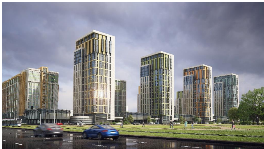
Рисунок 4. Жилой комплекс «Времена года», г. Нур-Султан

В жилой архитектуре элементами национального искусства могут служить как форма самого объекта (жилой комплекс в виде орнамента – фотография №5) или же элементы национального искусства «ою-өрнек» как декоративный элемент фасада жилого комплекса.