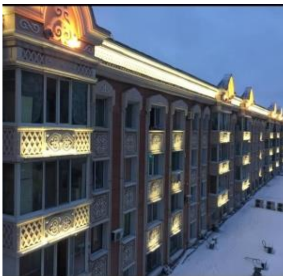
Рисунок 6. Декоративный фасад с национальными элементами