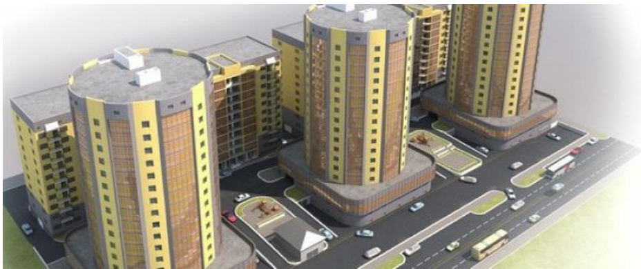
Рисунок 3. Жилой комплекс «Мунар», г. Нур-Султан