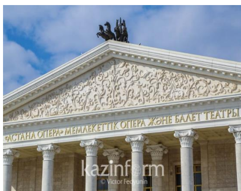
Рисунок 8. Декоративный фасад с национальными элементами

Новые постройки, образующие ансамбль г. Нур-Султан, вписывались в уже сложившуюся структуру со времён г. Целинограда, что в некоторой степени усложнило формирование целостного и гармоничного облика столицы.