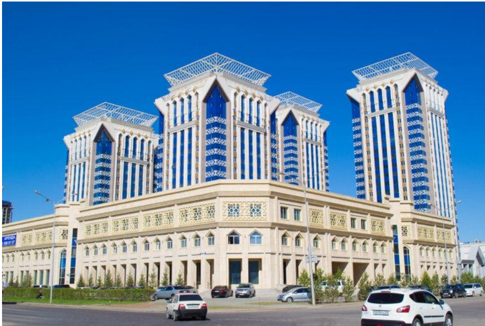
Рисунок 2. Жилой комплекс «Миллениум парк», г. Нур-Султан