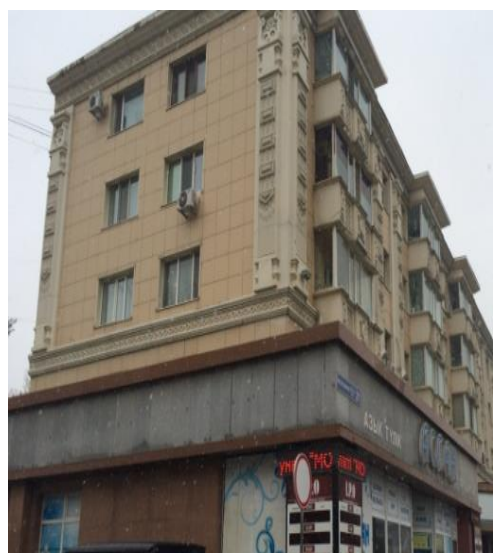
Рисунок 7. Декоративный фасад с национальными элементами

Новые постройки, образующие ансамбль г. Нур-Султан, вписывались в уже сложившуюся структуру со времён г. Целинограда, что в некоторой степени усложнило формирование целостного и гармоничного облика столицы.