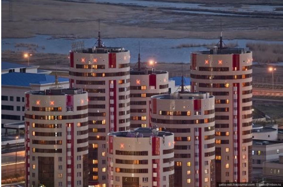
Рисунок 1. Жилой комплекс «Семь бочек», г. Нур-Султан