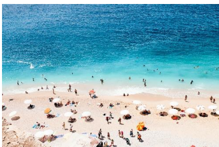
1 сурет. Жағажай