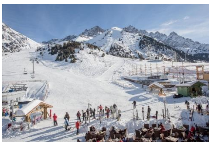
2 сурет. Тау шаңғы курорты