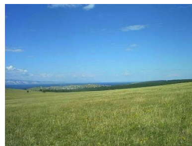
3 сурет. Жазықтық

Анықтамадан көрініп тұрғандай, ресурстардың бұл түрі шығу тегінің ерекшеліктерімен емес, пайдалану сипатымен ерекшеленеді. Іс жүзінде барлық табиғи ресурстар рекреациялық және туристік әлеуетке ие, бірақ оны пайдалану деңгейі әртүрлі және аймақтың рекреациялық сұранысы мен мамандануына байланысты.