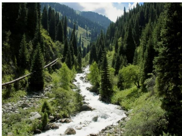
4 - сурет. Алматыдағы Алмарасан шатқалы

Табиғи рекреациялық ресурстардың негізгі нысандары - үлкен қалалардың айналасындағы "жасыл аймақтар", қорықтар, ұлттық парктер болып табылады. Бұл аумақтар әсіресе адамзат қоғамының әсеріне ұшырайды және ерекше қамқорлық пен бақылауды қажет етеді. Табиғи кешенді тұтастай қорғау және зерттеу үшін шаруашылық пайдаланудан толығымен шығарылған табиғи аумақ - қорықтар болып саналады. Қорықтардың негізгі міндеттерінің бірі-осы аумаққа тән немесе ерекше табиғи ландшафттарды сақтау. Қорғалатын табиғи аумақтардың неғұрлым құнды нысаны - бұл тек экономикалық қызметтің жекелеген түрлеріне тұрақты немесе уақытша тыйым салынған қорық. Қорғалатын аумақтың келесі түрі - ұлттық саябақтар. Ұлттық саябақтар әлемдік тәжірибеде кеңінен қолданылады.