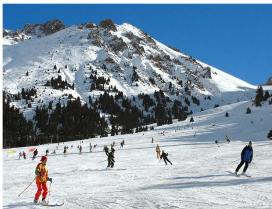
7 - сурет. Шымбұлақ тау-шаңғы курорты

Осыған орай Қазақстанның табиғи тау рекреация ресурстары еліміздің әл ауқатын ғана жақсартып қоймай, рухани байлығында арттыруда деп сенімді айта аламыз!