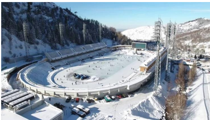
6 - сурет. Медеу мұз айдыны

Шымбұлақ тау-шаңғы курорты осы күнге дейін еліміздің, әсіресе Алматы қаласының тұрғындарының күннен-күнге тау шаңғысымен шұғылдануына септігін тигізіп келеді. Қазіргі таңда «Шымбұлақ» тек табиғи ресурс ғана болып табылмай мәдени орталыққа да айналды, түрлі Олимпиада шаралары мен әлем Чемпионттары жүргізіліп отырады.