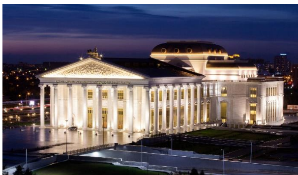
Рисунок 5. Вид фасада в ночное время

Внутри и внешне театр отделан специальным сицилийским мрамором, благодаря этому здание оперы будет украшать Астану максимально долго, ведь мрамор — натуральный и вечный камень.