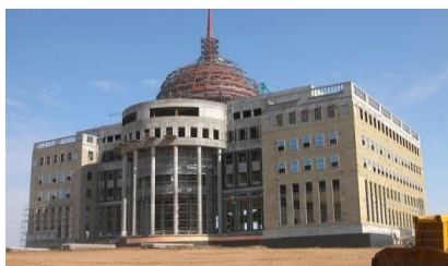
Рисунок 3. На стадии реализации