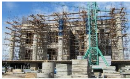
Рисунок 8. На стадии реализации