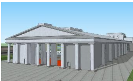
Рисунок 7. 3D модель здания

У каждого элемента «навесной» фасадной части здания есть своё название и функциональная принадлежность. Фасадные декоративные элементы – это не просто красивые, выпуклые формы, это важная часть конструктивной оснастки.