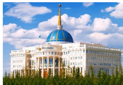
Рисунок 4. Завершенный

Следующим идет здание признанное памятником архитектуры национального значения - Государственный театр оперы и балета «Астана-опера», основанный и построенный по инициативе первого президента Казахстана Нурсултана Назарбаева.