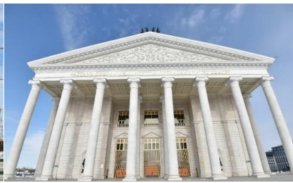
Рисунок 9. Завершенный

Создание современного образа города, имеющего статус столицы невозможно представить без знаковых общественных зданий (такие как ТРЦ «Хан Шатыр», Мечеть «Хазрет Султан», Концертный зал «Казахстан», Президентская Резиденция «Акорда», Государственный театр оперы и балета «Астана-опера» и т.д), собранных из архитектурных элементов в целом.