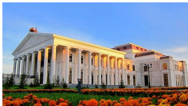
Рисунок 6. Вид фасада в дневное время