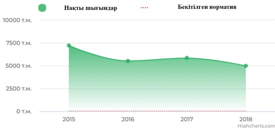
Сурет-2. Атмосфераға ластаушы заттар шығындыларының көлемі [15]

процесін жеделдетуде, яғни адами және табиғи факторлар әсерін судағы биогенді элементтердің артуы, нәтижесінде шөгінді заттар шамадан тыс көбейеді. Бурабай, Шортанды, Қарасу көлдерін экологиялық зерттеу нәтижелері, аталған көл суларының сапасы 3, 4, 5 кластық, яғни «орташа ластанған», «ластанған» және «лас» екенін көрсетті [17].