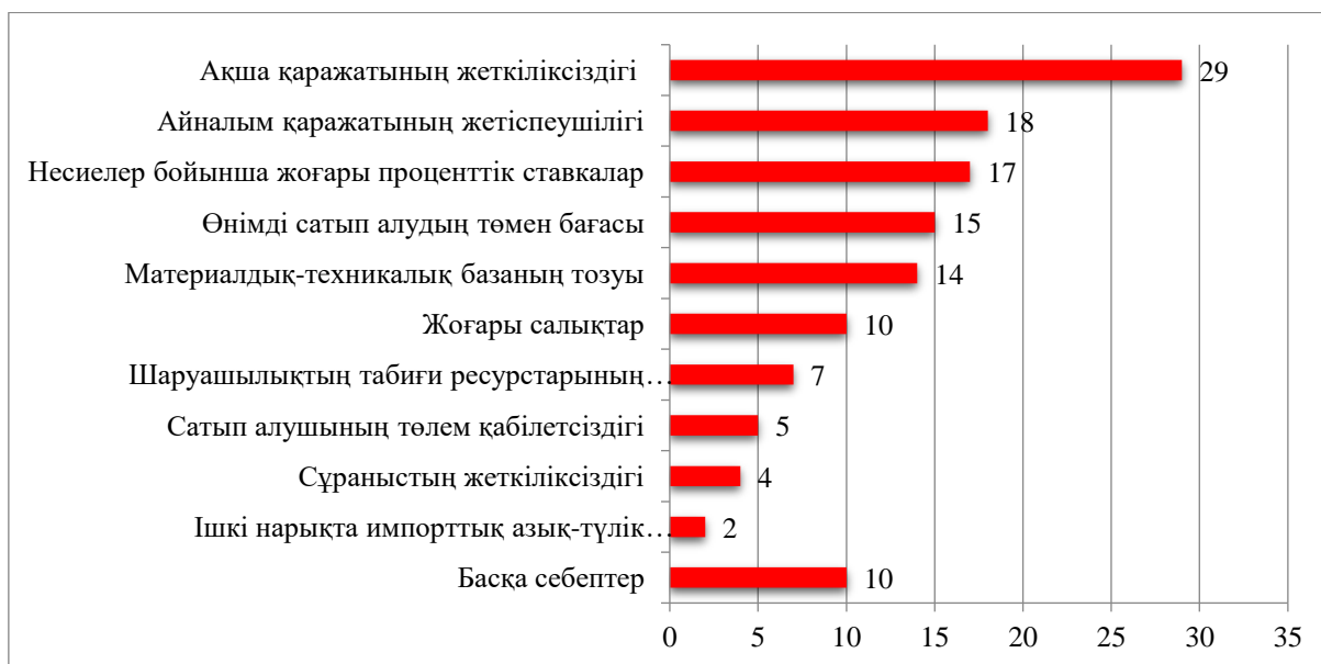
Сурет – 3. Ауыл шаруашылығындағы өндірістік қызметті және кәсіпкерлік белсенділікті шектейтін факторлар

жабдықталуының төмен болуынан байқалады. Жергілікті және шетелдік нарықтарда өнімді өңдеу және сату процестері де жақсартуды қажет етеді (сурет 3-тен ауыл шаруашылығындағы кәсіпкерлік қызметті дамытпай отырған факторларды көруге болады).