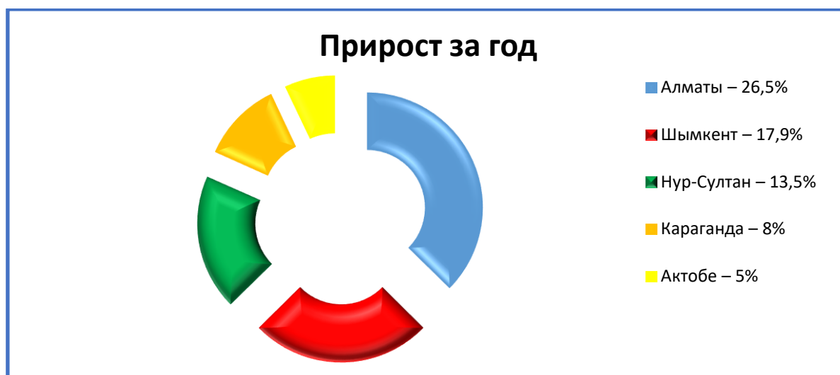
Рисунок - 3. Прирост заведений общественного питания за 2021 год

За 2021 год число заведений общественного питания в пяти крупнейших городах Казахстана приблизилось к 10 000.