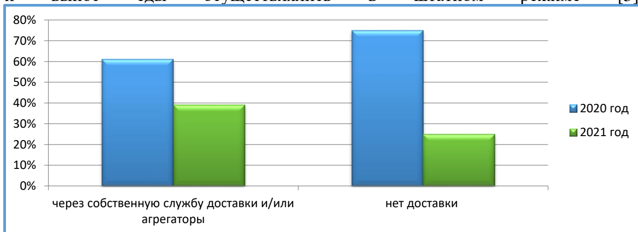
Рисунок - 1. Наличие доставки в предприятиях общественного питания на 2020 и 2021 года

Согласно Постановлению государственного санврача столицы Сархат Бейсеновой от 11 июля 2021 года, разрешалось организовывать работу заведений общественного питания с соблюдением социальной дистанции не менее двух метров между соседними столами, и обязательное условие - заполняемость до 50%, но не более 30 посадочных мест (ранее заполняемость в ресторанах составляла 30%); график работы заведений в будние дни составлял с 07:00 до 20:00 с запретом деятельности в субботу и воскресенье, летним кафе разрешалось работать с числом посадочных мест не более 30 с графиком работы в будни с 07:00 до 22:00, кроме выходных. Для банкетных залов (обслуживание по типу ресторанов и кафе, проведение поминок), участвующих в Ashyq, установлен режим работы внутри помещения в будние и выходные дни с 07:00 до 22:00, а на открытом воздухе (летние залы) с 7:00 до 24:00. При этом доставка и вынос еды осуществлялись в штатном режиме [3].