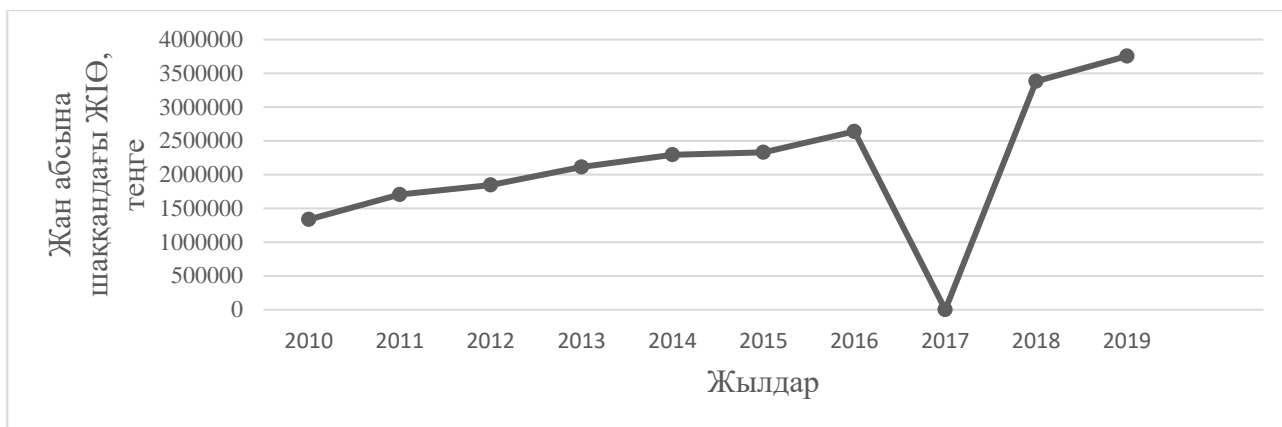
Сурет 2 – Қазақстанның 2010-2019 жылдар аралығындағы жан басына шаққандағы ЖІӨ

Ескерту: [3] негізінде автормен әзірленген