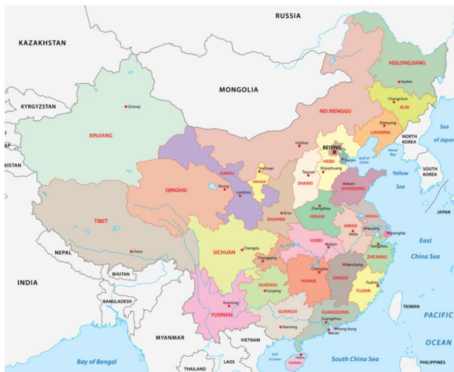
Рис. 1. Политическая карта КНР

Имеющиеся выходы к морю через основные порты Dalian (9,707,000), Guangzhou (18,858,000), Ningbo (24,607,000), Qingdao (18,262,000), Shanghai (40,233,000), Shenzhen (25,208,000), Tianjin (15,040,000) TEUs (2017) [3].