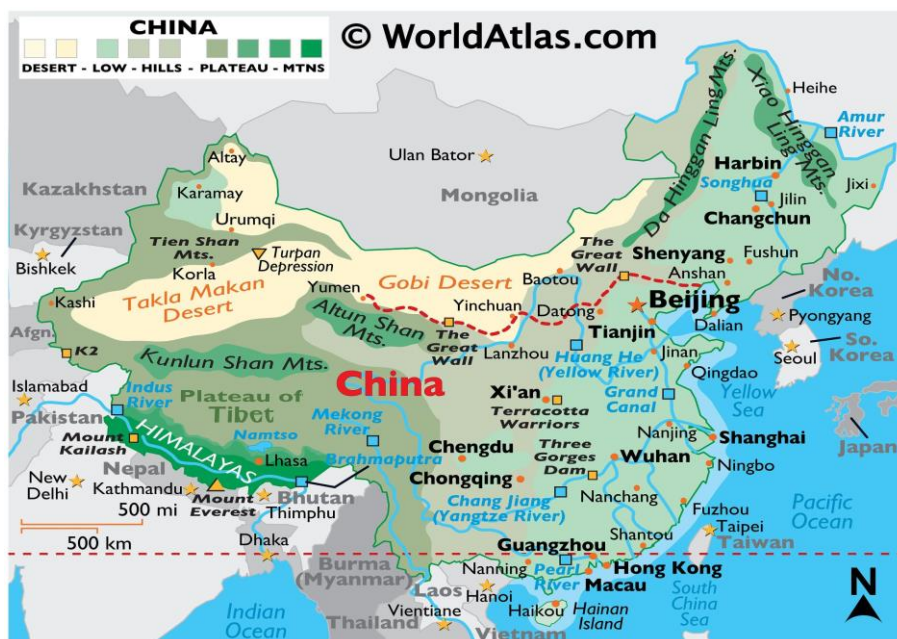
Рис. 2. Природно-географическая карта КНР

Из всех доступных комбинаций по сдерживанию Китая наиболее эффективными следует признать вопросы полуострова и региона южно-китайского моря. Как можно увидеть на физической карте ниже, для этого существует подробное объяснение почему: