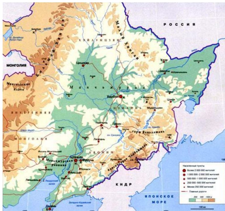
Рис. 4. Карта Манчжурии

Ответ на этот вопрос кроется в геополитических вопросах современности и вопросах национальной безопасности КНР. Глупо отрицать, что КНР являясь единственным союзником КНДР в полной мере явно или косвенно поддерживает северокорейский режим дипломатически, военно и финансово. Ключевой линией в данном вопросе почему Пекин поддерживает Пхеньян является река Хэйлунцзян.