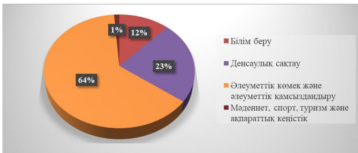
Сурет 2 - Әлеуметтік блоктың 2019 жылға арналған шығыстарының құрылымы

Әлеуметтік блокқа («Білім беру», «Денсаулық сақтау», «Әлеуметтік көмек және әлеуметтік қамсыздандыру» және «Мәдениет, спорт, туризм және ақпараттық кеңістік» функционалдық топтары) жұмсалатын шығыстардың өсуі жалғасып отыр. Мәселен есепті кезеңде шығыстар 2018 жылмен салыстырғанда 939,7 млрд. теңгеге немесе 21,9%-ке (2018 жылы – 4 274,6 млрд. теңге) ұлғая отырып, 5 214,5 млрд. теңгені құрады. Алайда мұндай шығыстардың үлесі 2019 жылдың қорытындысы бойынша шығыстардың жалпы көлеміне шаққанда 2018 жылдың деңгейіне қарағанда 1,2 п.т.-ға төмендеумен 41%-ті құрады.