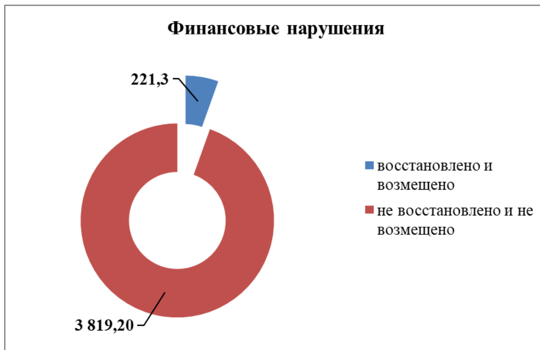
Рисунок 2. Показатель финансовых нарушений

В ходе государственного аудита выявлено 7 нарушений порядка выполнения процедур на общую сумму 575 250,0 тыс.тенге.