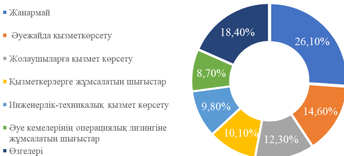
1- сурет «Эйр Астана» Акционерлік компаниясының 2019 жылғы операциялық шығыстары

Квазимемлекеттік сектор субъектісі ретінде «Эйр Астана» Акционерлік қоғамының қаржылық тиімділік көрсеткіштеріне назар аудардық. Air Astana (заңды атауы «Эйр Астана»)-Қазақстан Республикасының авиатасымалдаушы, «Нұр-Сұлтан» және «Алматы» әуежайларынан ішкі және халықаралық тұрақты рейстерді орындайтын еліміздегі ең ірі авиакомпания. Компания «Самұрық-Қазына» ұлттық әл-ауқат қоры (51%) мен британдық BAE System PLC (49%) компаниясының 2001 жылғы қазанда құрылған бірлескен кәсіпорын болып табылады.