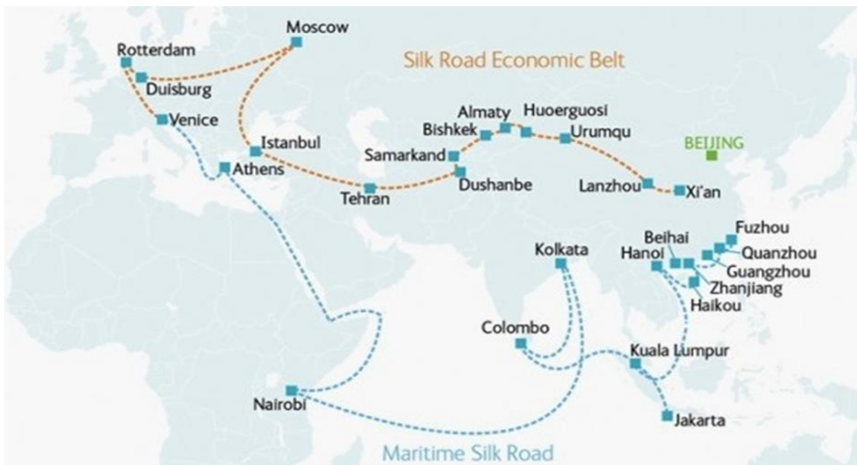
Рисунок 2. Проект КНР «Шёлковый путь». Синей пунктирной линией обозначен МШП, коричневой – ЭШП [4].

В 2015 году более 80% объема международной торговли товарами был произведён по морю. В стоимостном выражении доля морских перевозок оценивается примерно в 60-70% всей международной торговли, и в рамках Средиземноморской морской торговли потоки составляют 25% от общей торговли по морю [5].