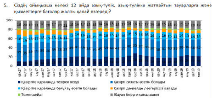
1-сурет. Халықтың азық-түлік және азық-түлікке жатпайтын тауарлар мен қызметтерге бағаның өзгерісі туралы ойлары (2017-2019жж.)

Келесі графиктардан инфляциялық күтулер бойынша халыққа жүргізілген пікіртерім нәтижелерін көруге болады. [7]