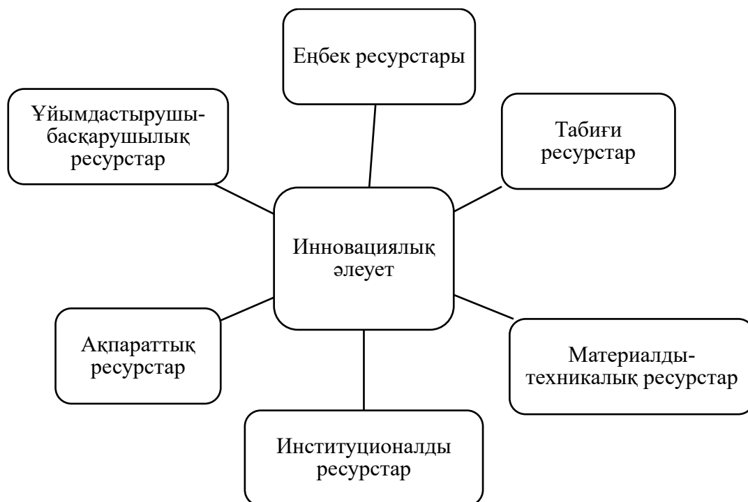
Сурет 2 - Кәсіпорынның иновациялық әлеуетінің құрамы Ескерту – сурет [3] деректер негізінде құрастырылған

д) ақпараттың қол жетімділігі мен сапасы.