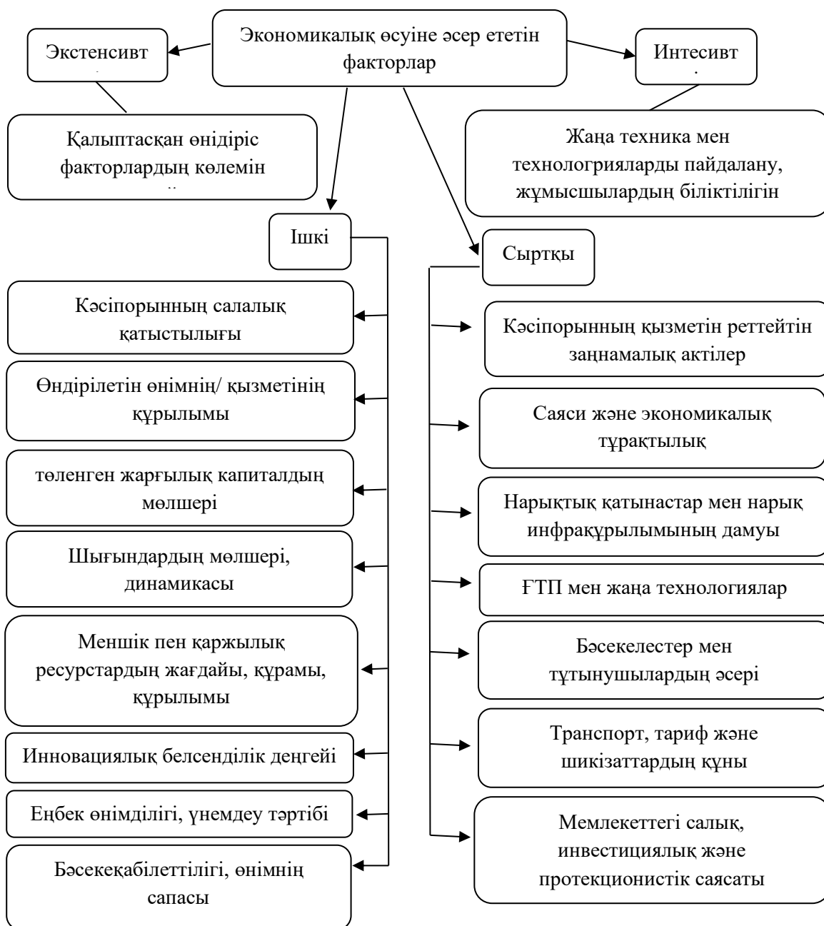
Сурет 3. Кәсіпорынның экономикалық өсуіне әсер ететін факторлар

Ескерту – автормен құрастырылған; [2] дерек көзінің мәліметтері пайдаланылған