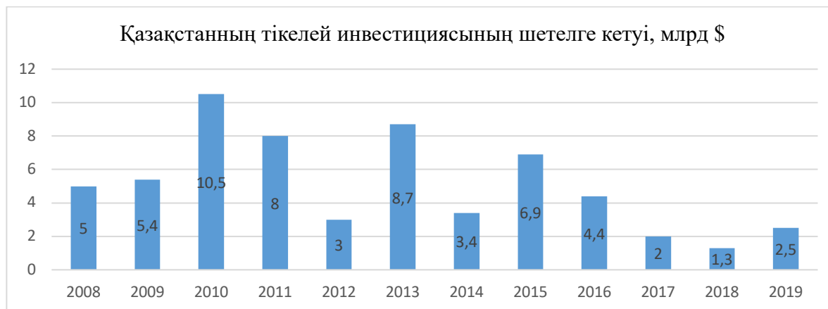
Сурет 1. Қазақстанның тікелей инвестициясының шетелге кетуі

Тікелей инвестициялар бойынша капиталдың таза әкетілуі (теріс сальдо) 2019 жылғы 1-жартыжылдықта 3,7 млрд долларды (2018 жылғы 1-жартыжылдықта 4,3 млрд доллар) құрады және резиденттердің активтері қысқаруымен және міндеттемелерінің өсуімен қамтамасыз етілді [1].