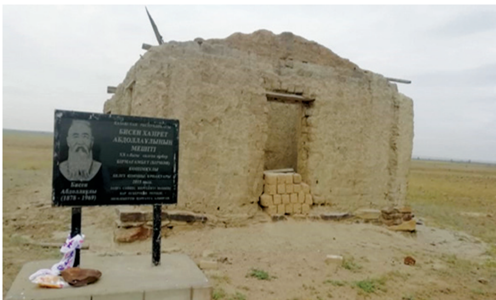
Фото 11. Мечеть Бисен хазрета в местности Жаманкол, Хобдинский район.