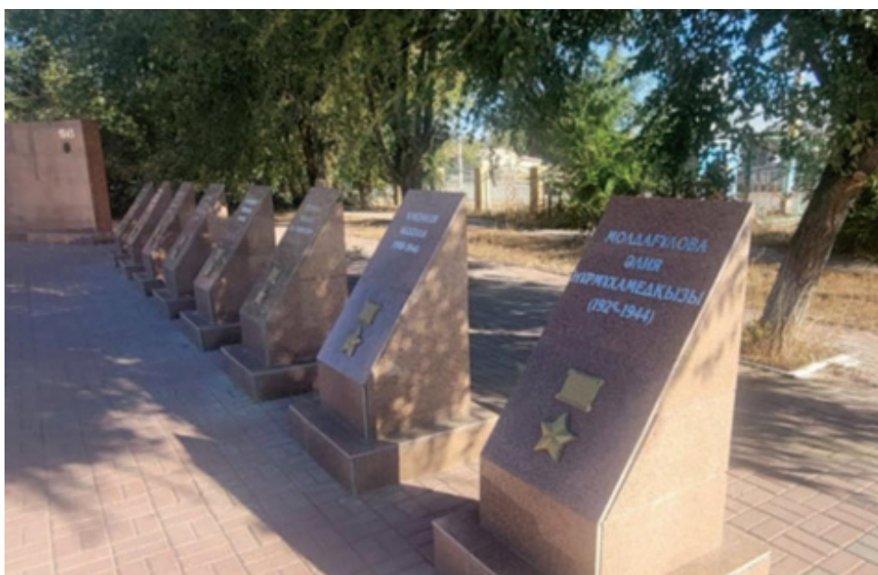
Фото 8. Памятные знаки кобдинцам – героям Советского Союза.