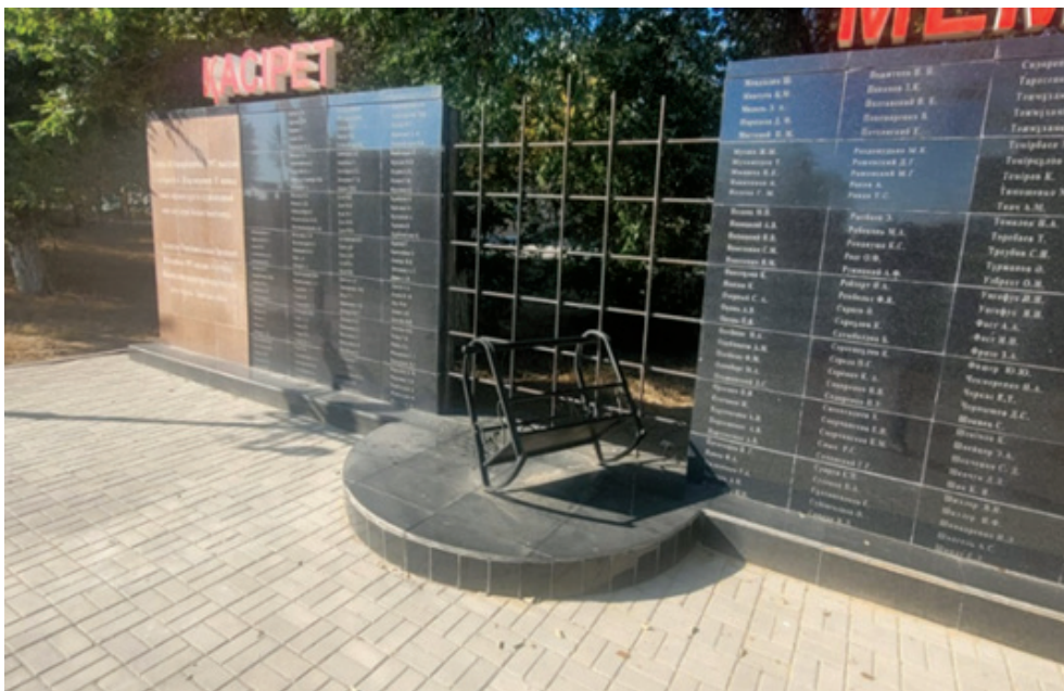
Фото 9. Стена памяти «Қасірет мемориалы» в парке «Маңгілік ел» села Кобда.

опустевший бесік (колыбель), все вместе символизирующие перенесенные казахским народом страдания, потери и жертвы. В контексте репрезентаций героического и трагического в пространстве мемориального комплекса, незаметная локация «Қасірет мемориалы», на наш взгляд, отражает текущее осторожное отношение государственных органов к теме голода и политических репрессий. Если «Аллея батыров» как тематическая зона доминирует и занимает значительную часть территории мемориального комплекса, то стена памяти, транслирующая травматическое прошлое, находится в глубине центрального парка, вдали от основных пешеходных маршрутов, и чтобы найти ее от посетителей мемориального комплекса потребуется значительное усилие.