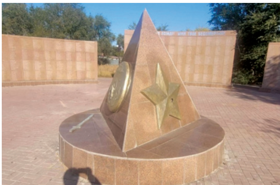
Фото 6. Памятный знак на Аллее Батыров в парке «Мәңгілік ел» села Кобда.

Образы и нарративы героического прошлого призвана транслировать Аллея батыров, расположенная в правой стороне мемориального комплекса. Свообразие аллеи, на наш взгляд, заключена в памятных знаках в центральной части композиции. Перед стеной памяти, где увековечены имена трех с половиной тысяч кобдинцев, не вернувшихся с фронтов Второй мировой войны, установлена небольшая пирамида, на одной стороне которой размещены қалқан (щит) и қылыш (меч) казахского батыра, на другой стороне – пятиконечная звезда, как символ советской армии (фото 6). С третьей стороны пирамиды нанесен текст на казахском, со следующим смысловым переводом: «Героический дух и деяния наших предков-батыров, защищавших свой народ и сражавшихся за его независимость, а также героев кобдинцев, участвовавших в Великой Отечественной войне, навечно будут сохранены в памяти молодого поколения».