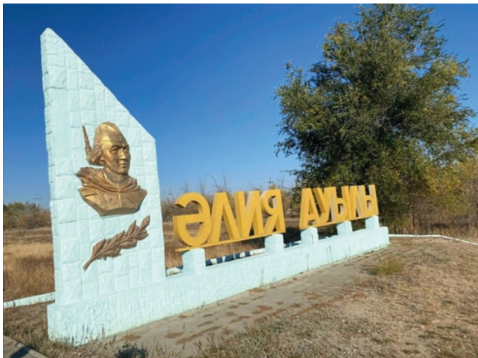
Фото 1. Въезд в село Алия, Хобдинский район.

Память о батырах, мечетях и мусульманском духовенстве.