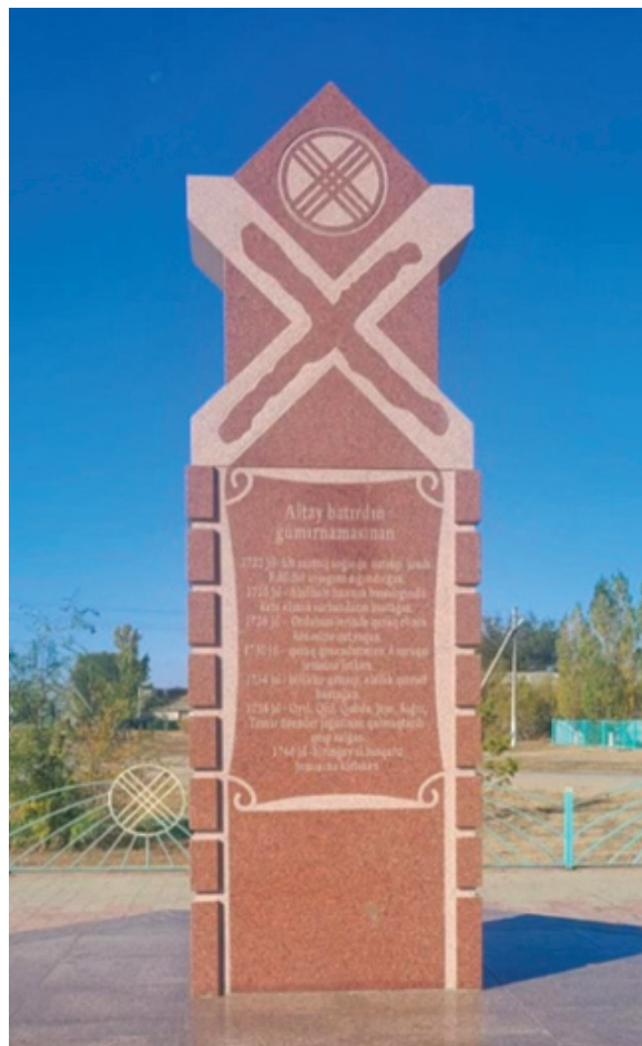
Фото 5. Стелла Алтай батыру.

Стелла Алтай батыру установлена в 2017 году в рамках проекта «Туған жер» (фото 5). Памятник появился благодаря его потомкам и представителям рода Кете, который является одним из подразделений крупного рода Алимұлы в составе Младшего жуза.