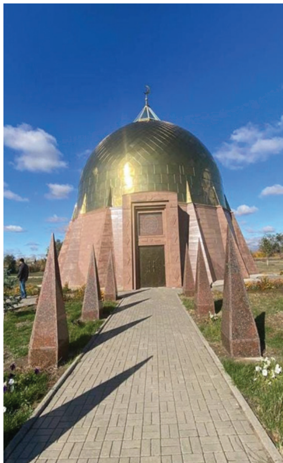
Фото 3. Мавзолей Кобланды батыра (архитектор Бек Ибраев, 2007 г.).

В селе Кобда конный памятник Исатаю Тайманулы (фото 4), одному из руководителей восстания казахов 1836-1838 годов против вассального от Российской империи хана Букеевской Орды, также установили в 2017 году во время общественной акции в рамках государственной программы «Рухани жаңғыру».