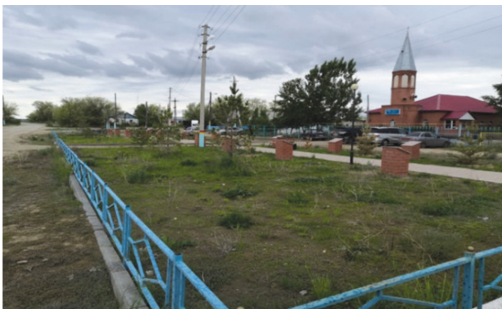
Фото 10. Аллея памяти мусульманским религиозным деятелям.

хазрета. Ее активизм памяти начался с популяризации жизни и деятельности деда. В последующем она провела консервацию и смогла добиться включения полуразрушенного и заброшенного в степи здания мечети, построенного Бисен хазретом, в официальные реестры памятников областного значения и списки сакральных объектов региона (фото 11).