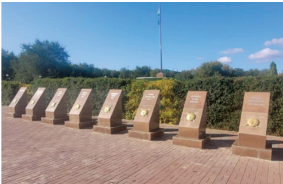
Фото 7. Памятные знаки казахским батырам.