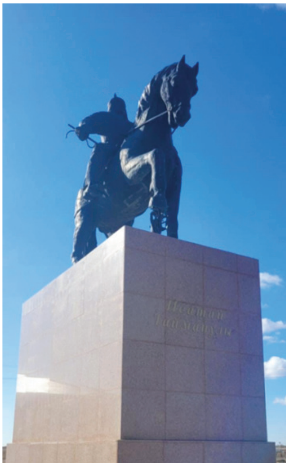
Фото 4. Памятник Исатай батыру при выезде из села Кобда в сторону г.Уральск (архитектор Н. Имашев, скульптор С. Каербаев, 2017 г.) (фото Д. Оразбаевой).