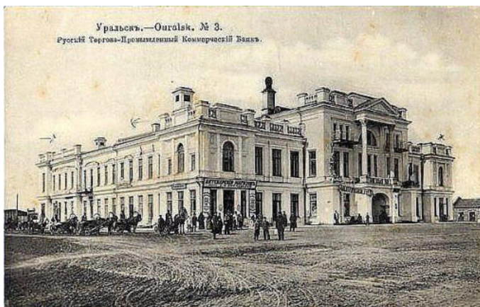
Сүрет 5. Сауда-өнеркәсіптік банк (1904 жыл).