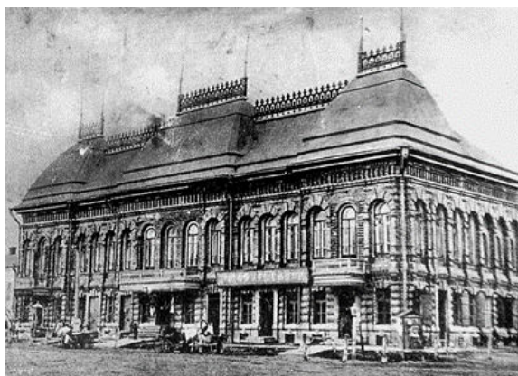
Сүрет 1. Ванюшиндер үйі (1880 жылы).

бағаналар, бағаналар, эркерлер, фронтондар, ризалиттер, пилястрлар, карниздер, кронштейндер, қуыстар жатады.