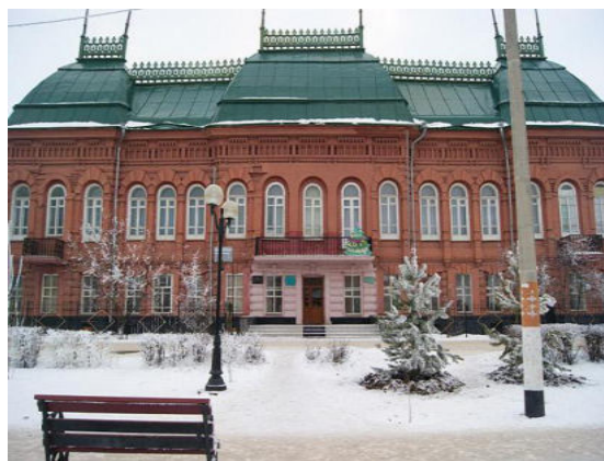
Сүрет 2. Ванюшиндер үйі қазіргі көріні