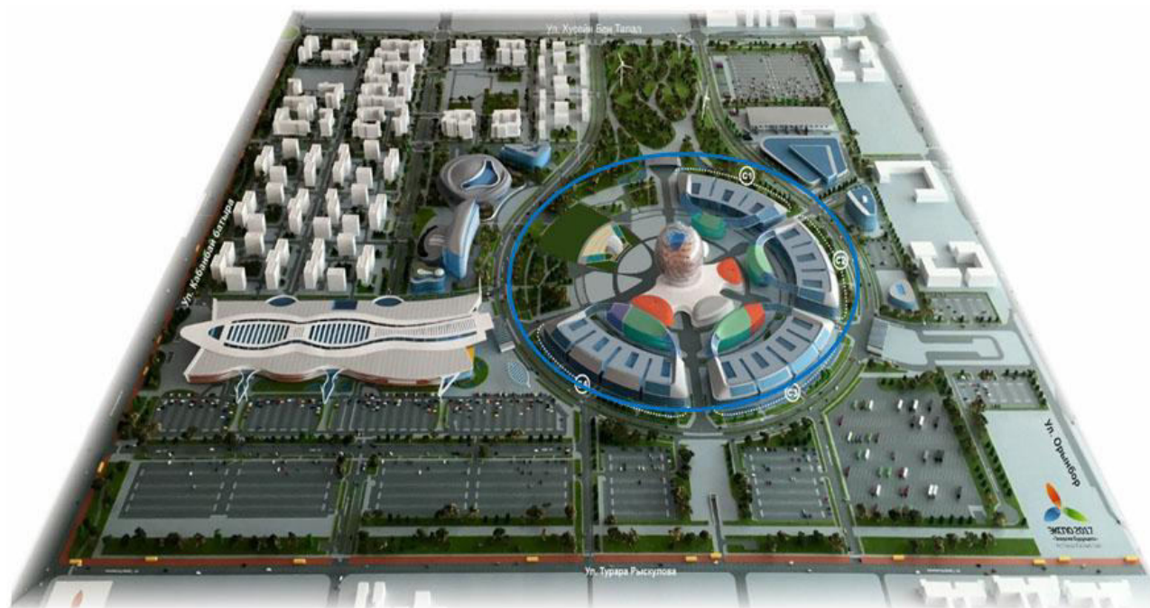
Сурет 2 Экспо ауданының жоспары

Қалалық ортаны дамыту процестерін реттеу үшін қала құрылысы және аумақтық жобалау-жоспарлау құжаттамасы – аумақтық және қала құрылысы ресурстарын тиімді пайдалануды, даму процестерін оңтайландыруды, қала құрылысы тәртібін сақтауды қамтамасыз ететін қоныстар мен аумақтарды дамыту перспективаларын айқындайтын құжаттар жүйесі маңызды мәнге ие.